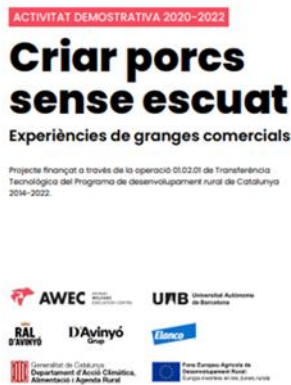
Foto 3. Document tècnic amb els resultats de l'activitat.

Les fitxes tècniques s'han ajuntat en un mateix document en format de guies pràctiques (Foto 3) i són accessibles a la web www.fawec.org ( Innovaciones en la práctica veterinaria (fawec.org) ).