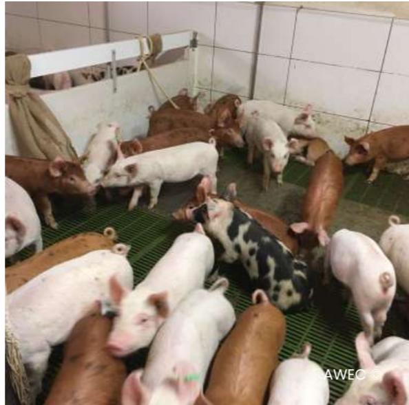
Imatge 03 Corral de transició.