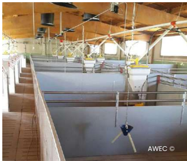
Imatge 04 Nau d'engreix.