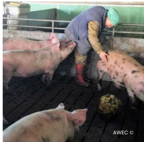
Imatge 09 Criar porcs amb les cues llargues suposa dedicar més temps a la supervisió dels animals.

de feina per setmana , especialment dedicades al canvi de les cordes i sacs de jute (primer lot). Quan no es van dedicar les hores suficients, els brots es van disparar més (segon i tercer lots). Dedicar temps en l'observació dels canvis de comportament i la prevenció dels brots permet reduir considerablement la incidència de mossegades de cues a la transició. - Per l'engreix (1 nau, 500-550 porcs): 2 hores més de feina per dia . Hores dedicades a l'observació molt curiosa dels animals, la separació dels animals altament mossegadors, l'obertura dels corralins quan es detectaven un inici de caudofàgia i el canvi diari de material manipulable.