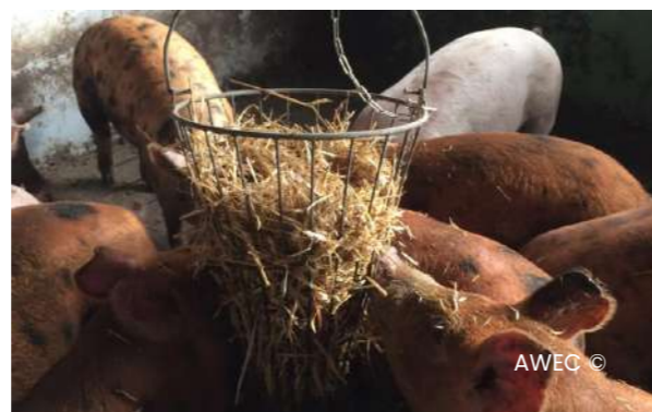
Imatges 07 Pals de fustes de roure o alzina i dispensadors de palla per porcs d'engreix. A finals d'engreix les fustes duraven 3 dies, llavors s'havien de canviar.