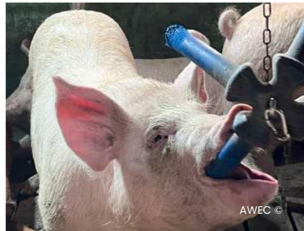
Imatges 06 Exemples de joguines que han resultat atractives pels porcs d'engreix. Important que les joguines es penjin a nivell del morro dels porcs i que no s'embrutin.