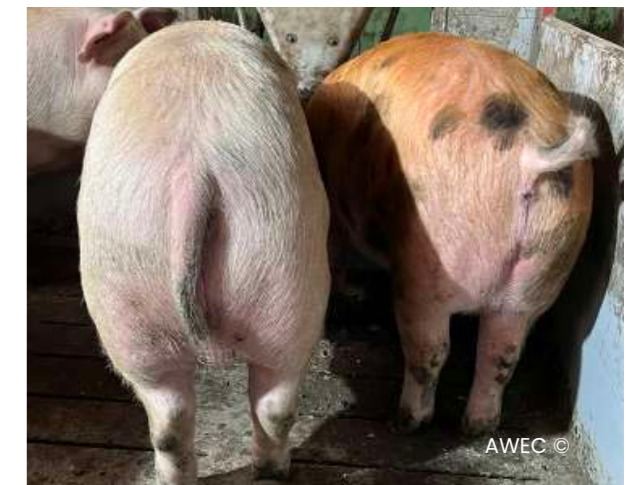
Imatges 08 Un porc amb la cua cap avall i amagada entre les cames (porc a l'esquerra) és indicatiu de mossegades de cues a la corralina.

01. Animals molt agitats, molt nerviosos. 02. Manipulació de les cues excessiva. 03. Porcs amb les cues cap avall, amagades entre les cames i oscil·lant.