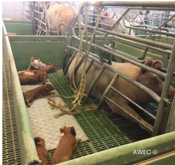
Imatge 02 Maternitat amb cordes pels garrins.

“Val la pena prevenir comportaments redirigits com la caudofàgia des de la maternitat.”