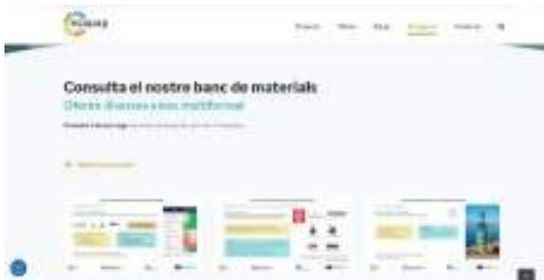
Foto 2. Repositori d'innovacions a la web del projecte (elaboració pròpia).