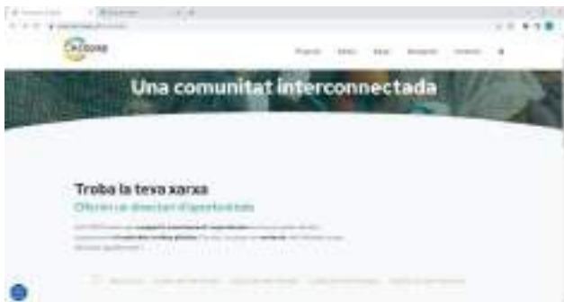
Foto 3. Comunitat multiactor a la web del projecte (elaboració pròpia).