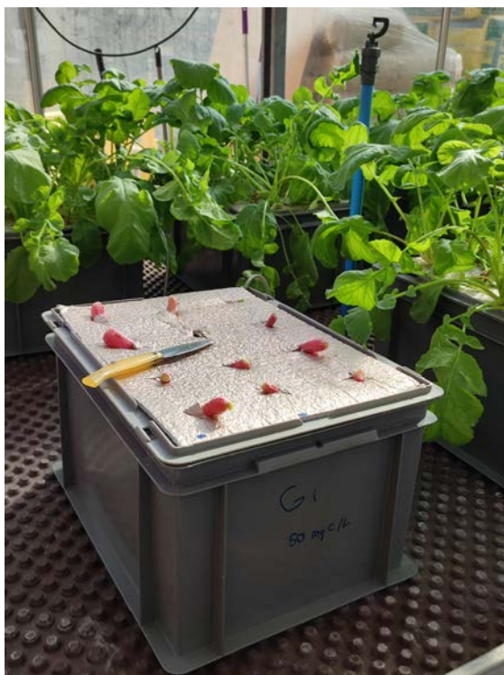
Figura 3. Sistema de cultiu hidropònic: cubeta de 20 litres, amb solució nutritiva, i 12 plantes de rave per cubeta.

plantes de rave a cada cubeta. S'avaluarà el creixement de la part aèria, del rave i de les rels de cada planta, individualment, així com llur contingut de nutrients. Experiments preliminars (que cal considerar com a preparació dels definitius) s'han dut a terme a fi d'establir les dosis més adequades dels humats per a la planta triada (rave).