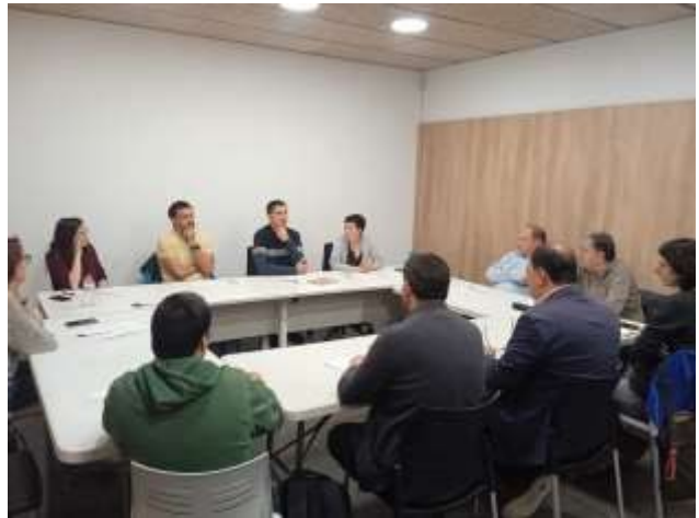
Foto 1. Taller debat a Arbúcies