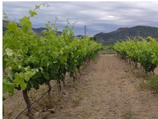
Foto. Desenvolupament vegetatiu, parcel·la de Vinebre.

Durant tot el cicle vegetatiu del cep es realitzen controls del desenvolupament vegetatiu (seguiment dels estadis fenològics segons l'escala estesa BBCH, borrons brotats/borrons latents deixats en poda, superfície foliar), fertilitat (raïms/brot), estat sanitari.