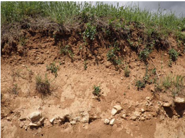
Imatge 2. Estrats de sòl

Es pot actuar sobre la fertilitat de les maneres següents: amb aportacions de matèries orgàniques, amb el treball del sòl, amb la rotació de cultius i evitant l'erosió.