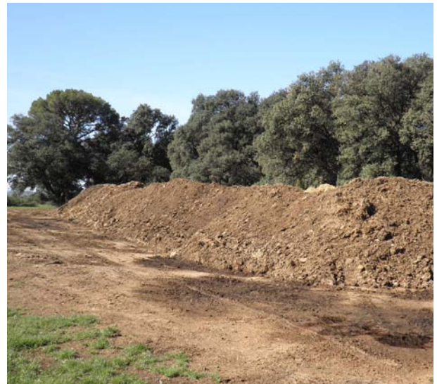
Imatge 5. Fem en procés de compostatge

Si en lloc d'incorporar directament la palla d'una collita d'uns 2.000 a 4.000 kg de palla/ha, la volem aportar en forma de fem compostat, s'hauria d'aportar a un camp, després d'un cereal, uns 1.000 a 3.000 kg/ha de compost, segons la proporció de dejeccions i el grau de compostatge.