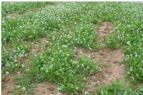
Imatge 12. La ravenissa millora la fertilitat del sòl

L'objectiu ha de ser controlar la seva presència a una densitat que no suposi una pèrdua important de collita. El concepte de "llindar econòmic" quantifica la densitat d'herbes adventícies, expressat en nombre de plantes/m 2 , per sota del qual el cost de la seva eliminació és superior a l'augment de producció que permetria. En agricultura convencional es refereix al tractament amb herbicides i, en agricultura ecològica, s'hauria de referir al cost del treball mecànic amb cultivador durant el cicle del cultiu. No es coneix l'existència de treballs experimentals sobre aquest tema.