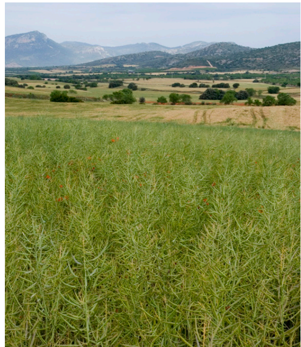
Imatge 1. Cultiu ecològic de colza

Amb l'objectiu de la sostenibilitat, les actuacions fonamentals són les que es fan per mantenir o millorar la fertilitat del sòl i les que mantenen la màxima biodiversitat cultivada i espontània possible.