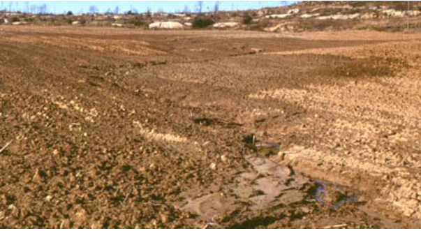
Imatge 7. Erosió del sòl en un camp amb poca pendent

Modificar el perfil natural del terreny. Fer terrasses per disminuir el pendent del camp i, per tant, l'escorrentia. Amb el moviment de terres no han de quedar zones amb el subsòl o la roca mare al descobert, sinó que amb la terra superficial desmuntada s'ha de reconstituir el perfil original de manera que hi hagi un mínim de 20-40 cm de terra fèrtil.