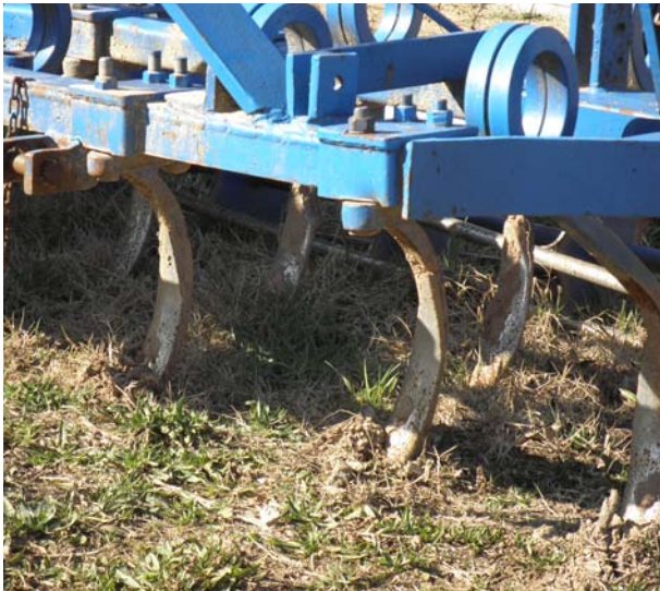
Imatge 6. El cisell respecta l'ordre dels horitzons del sòl

Es considera que es fa un treball massa agressiu sobre el sòl quan s'altera greument el seu estat natural, com quan es treballa amb una humitat superior a la de saó, quan s'inverteixen els horitzons d'un perfil de més de 15 cm de profunditat, quan es provoca la formació de sola de labor, quan es polvoritza i es destrueixen els agregats o quan es fa un treball de més de 20 cm de profunditat en una sola operació, sense progressió.