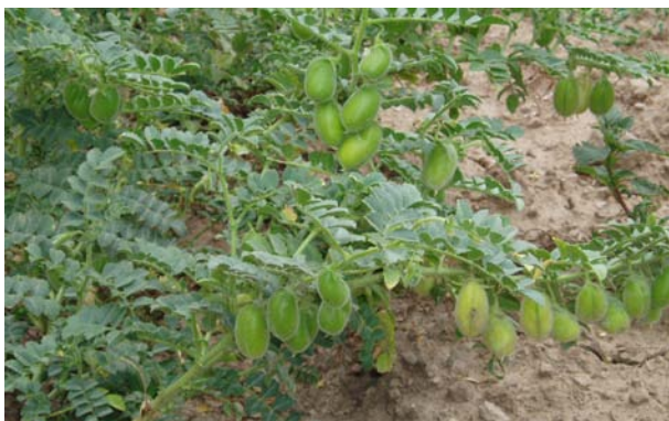
Imatge 9. Amb el cigró i altres lleguminoses es pot enriquir el sòl en nitrogen

La taula 1 no és exhaustiva; es pot afegir el triticale, el sègol, la fava, la patata, el lli, el cànem i altres. En total, s'han esmentat unes quaranta espècies pertanyents a nou famílies botàniques. Entre elles hi ha cultius per a alimentació humana o animal, de cicle anual o de durada més llarga, amb un sol tipus d'aprofitament o molt polivalents, i riques en proteïna, en energia o prou equilibrades. I això, sense incloure diverses espècies típiques de l'horticultura, però que poden ser cultivades al secà amb mètodes adaptats i una sèrie de plantes aromàtiques i condimentàries. Per tant, hi ha un gran ventall de possibilitats per diversificar els cultius d'una finca de secà.