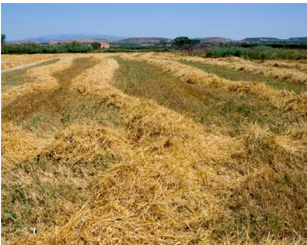
Imatge 4. La palla de cereals és un excel·lent adob orgànic

En una finca agrícola amb cria d'animals, aquests són uns competidors de la terra pel que fa a la utilització de la palla, ja que forma part de la ració dels remugants i és un dels materials més confortables com a jaç. Els remugants retornen una part de la palla amb les dejeccions, però una altra part és metabolitzada per a satisfer les necessitats de manteniment i producció. Amb les dejeccions, la palla va acompanyada de minerals, enzims, bacteris i altres elements que afavoreixen la seva descomposició. Amb el jaç passa el mateix, però la mescla no és tant diversa i rica.