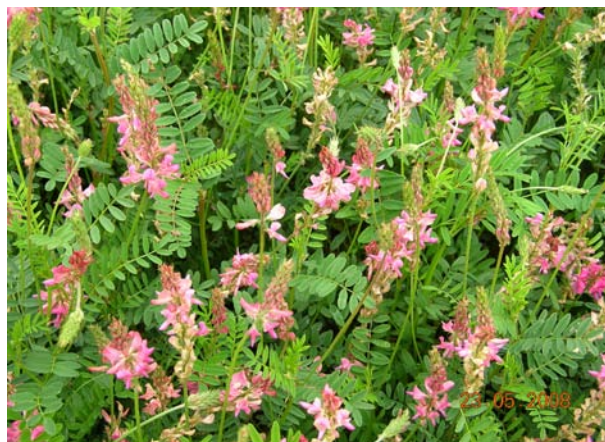
Imatge 10. Detall de trepadella

Cal considerar que, per cultivar algunes de les espècies de la taula 1, poden haver-hi alguns problemes. Un d'ells és la maquinària necessària, especialment la de sembra i la de recol·lecció, que en alguns casos és específica d'un cultiu (blat de moro, farratges...) i s'ha de valorar si convé fer la inversió o recórrer a l'ús en comú o al lloguer. Un altre problema és la possibilitat de venda, cosa que pot demanar a l'agricultor o agricultora una certa dedicació a la comercialització, que és bastant corrent en agricultura ecològica.