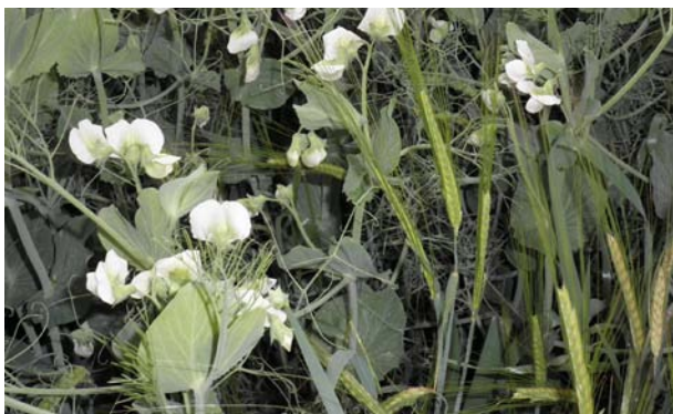
Imatge 13. Associació de pèsol i ordi per a gra

A la taula 4 hi figuren algunes associacions que han estat practicades, que es fan encara o que han estat recuperades recentment pel seu interès. No totes les associacions de la taula es poden cultivar pertot arreu a Catalunya, especialment algunes de farratgeres. Les dosis de sembra són orientatives, ja que es poden variar en funció de l'objectiu, com en el cas de l'associació de veça amb civada. Aquesta associació es pot sembrar i recol·lectar en tres èpoques al llarg de la campanya, tal com es veu a la taula 4.