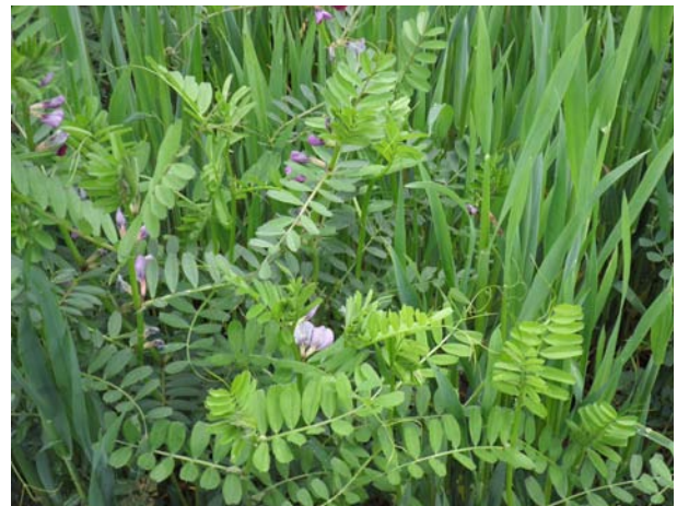
Imatge 3. Adob verd de veça-civada

A més, un adob verd té altres funcions, com mantenir el sòl protegit de l'erosió, de la compactació i del deteriorament de l'estructura a la superfície originades per les pluges intenses, retenir els minerals solubles i disminuir la població d'herbes espontànies.