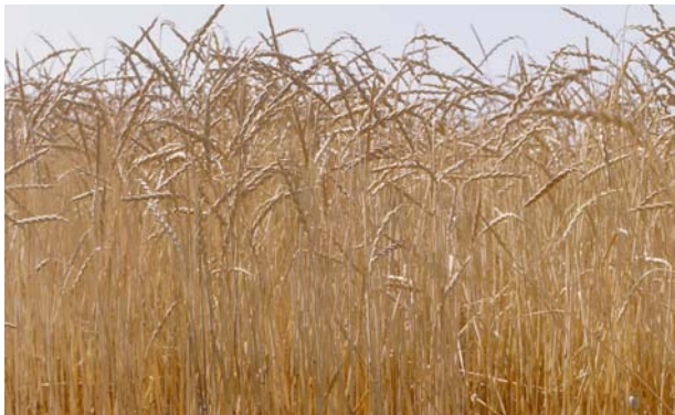
Imatge 8. L'espelta i altres cereals de palla alta deixen moltes restes orgàniques

El secà de Catalunya és molt divers quant a clima. Tenint en compte la pluviometria, hi ha des de zones àrides i semiàrides, amb menys de 500 mm de pluja anual, passant per zones semifrescals, amb 500-700 mm anuals i fins a zones frescals, amb més de 700 mm anuals. Això vol dir que totes les espècies de la taula no es poden cultivar pertot arreu, especialment algunes farratgeres i cultius d'estiu. Però, així i tot, les possibilitats de diversificar són molt grans.