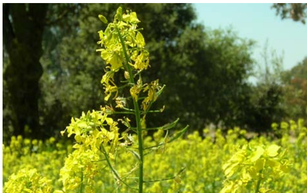
Imatge 11. Amb el cicle de la mostassa podem disminuir la presència d'herbes adventícies

i l'espai. També originen algun problema a la recol·lecció i poden fer necessari netejar la collita.