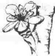
F. Flor oberta