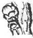
B. Borro inflat