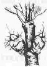
H. Quallat de fruits