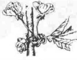
F. Flor oberta