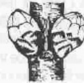
E. Hom veu els estams