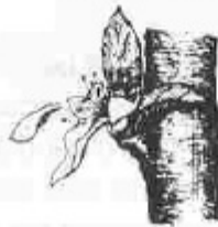
G. Caiguda de pètals