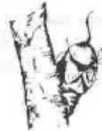
H. Fruita tendre