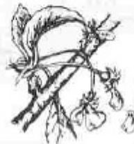
G. Caiguda de petals