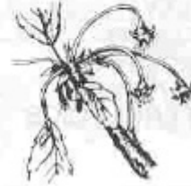
H. Qualitat de fruits