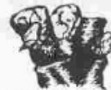
D. Els botons se separen