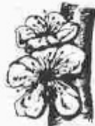
F. Flor oberta