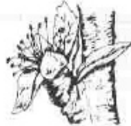
G. Caiguda de petals