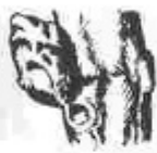
A. Borro d'hivern