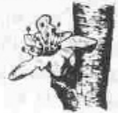
F. Flor oberta