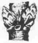
A. Borró d'hivern