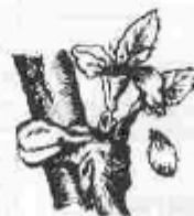
G. Caiguda de pètals