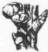
E. Hom veu els estams