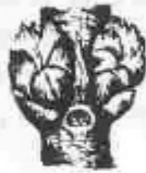
B. Comença a inflar-se