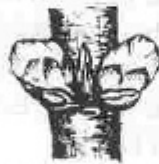
C. Hom veu el calze