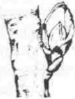
E. Hom veu els estams