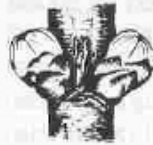
D. Hom veu la corolla