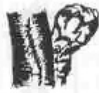
C. Botons visibles