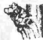
D. Botons separats