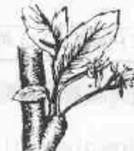
H. Quallat de fruits