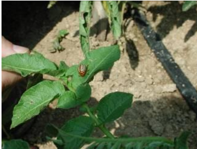
Imatge 3: Adult de L. decemlineata

Els danys són produïts pels adults (imatge 3) i les seves larves que s'alimenten de les fulles, brots i tiges tendres. Poden arribar a paraitzar el creixement de la patata. Es tracta doncs d'una plaga molt voraç i amb unes generacions que es solapen fent difícil el seu control. El període crític de defoliació de la patata és tot just abans i després de la floració. En aquest període la pèrdua de les fulles afecta greument la collita. L'aparició dels adults és esglaonada.