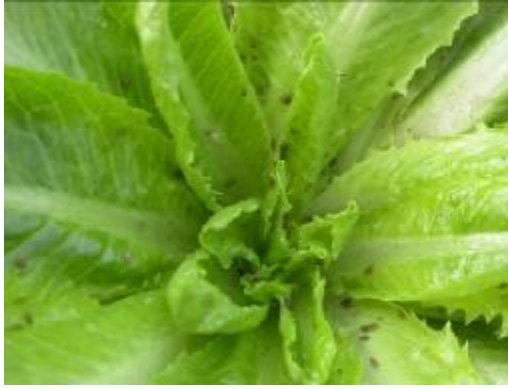
Imatge 4: Colònia de pugons en enciam