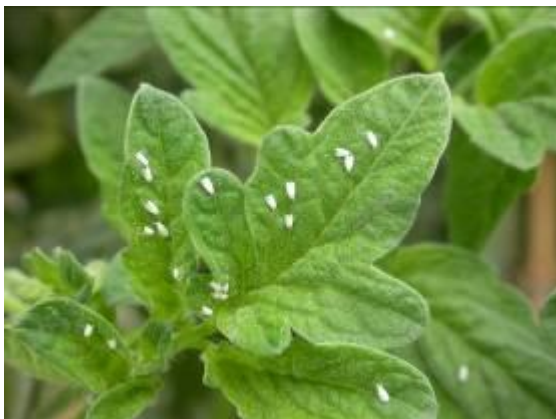
Imatge 2: Trialeurodes vaporariorum sobre fulla de tomaquera