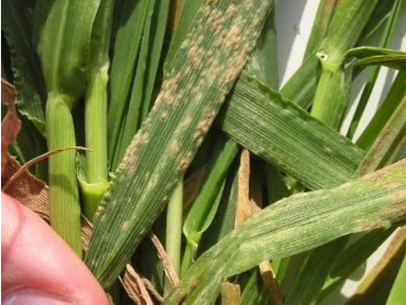
Blumeria graminis tritici/hordei Cendrosa del blat i de l'ordi