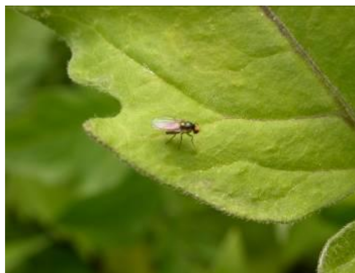
Imatge 1: Adult de Liriomyza trifolii

Insecte present en nombrosos cultius que afecta de manera important al tomàquet i la mongeta. Un dels seus trets característics és la taca groga que té al cap i la velocitat en que aixeca el vol. Aquesta plaga (imatge 1) ocasiona dos tipus de danys; picades alimentícies, que es manifesten en petits cercles blancs a sobre la fulla, i galeries formades per les larves, les quals generen gran quantitat de mines i poden arribar a reduir la capacitat fotosintètica de la fulla. Això afecta sobretot a les plantes més joves doncs es tradueixen en menors rendiments de la planta.