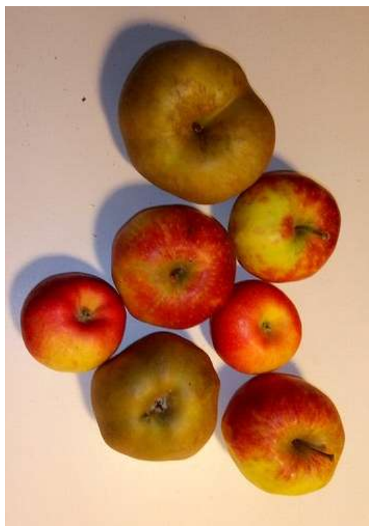
Diversitat varietal de pomes