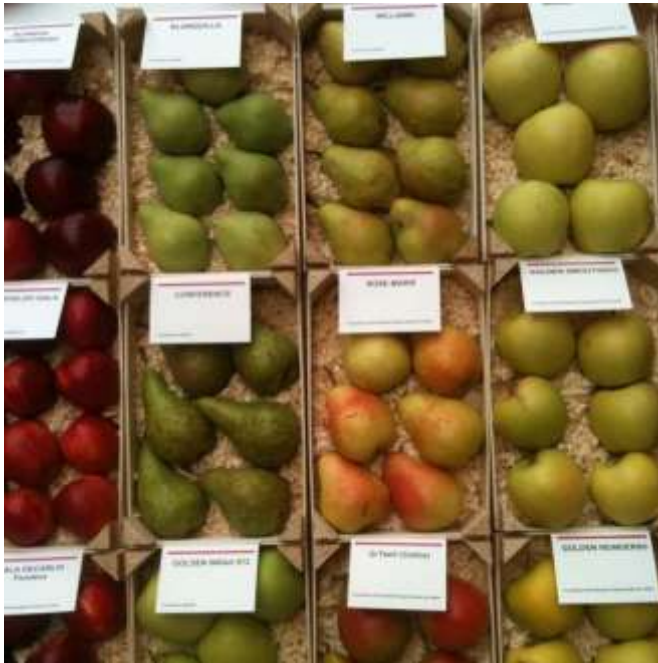
Exposició de varietats de pomes i peres a l'stand de l'@irtacat a la #FiraSantMiquel de Lleida 2015 https://www.instagram.com/p/8GFo9JrsYh/

(Informació actualitzada amb el BOE núm 297 de 12/12/2015)