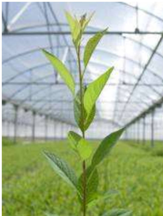
ROOTPAC-20 Densipac - Foto @rootpac http://bit.ly/rootpac20