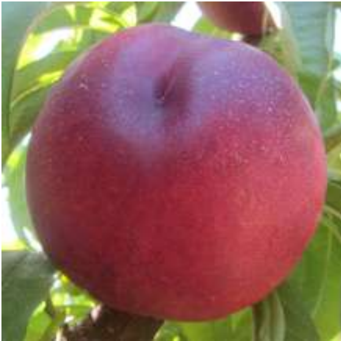
Nectarina amarilla Extreme © 618 - Foto Viveros Provedo http://bit.ly/2bOTM3E