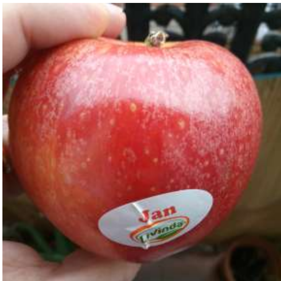
Etiquetatge personalitzat de les pomes

Aquest llistat només inclou les varietats de fruiters de les quals s'ha publicat la concessió de la protecció d'acord amb el Reglament europeu 2100/94 o la llei espanyola 3/2000.