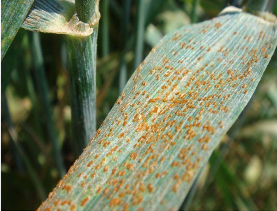
Puccinia recondita Rovell bru del blat