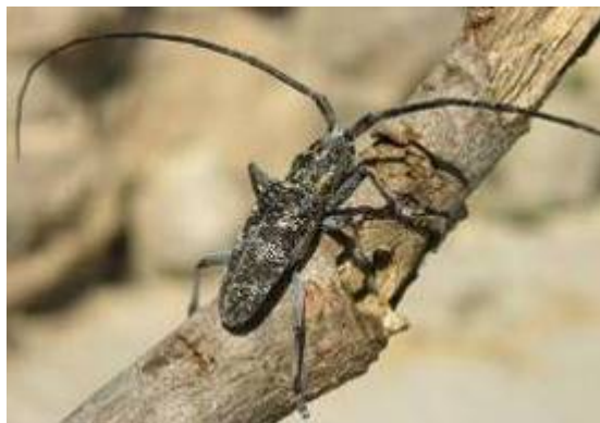
Adult de Monochamus sp., vector del nematode