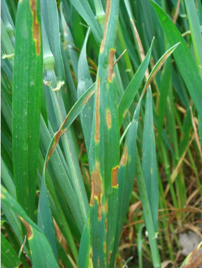
Septoria tritici Septoriosi del blat