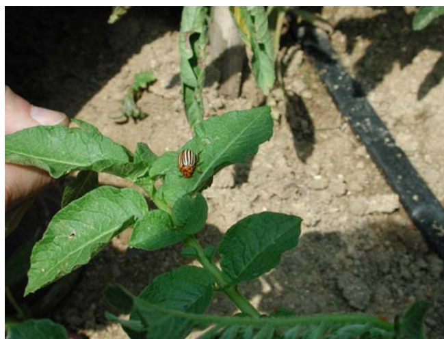
Imatge 3: Adult de L. decemlineata

Els danys són produïts pels adults (imatge 3) i les seves larves que s'alimenten de les fulles, brots i tiges tendres. Poden arribar a paraitzar el creixement de la patata. Es tracta doncs d'una plaga molt voraç i amb unes generacions que es solapen fent difícil el seu control. El període crític de defoliació de la patata és tot just abans i després de la floració. En aquest període la pèrdua de les fulles afecta greument la collita. L'aparició dels adults és esglaonada.