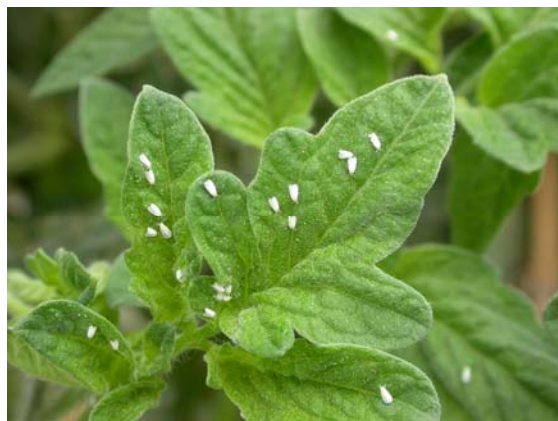
Imatge 2: Trialeurodes vaporariorum sobre fulla de tomaquera