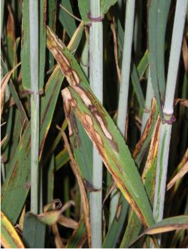
Rhynchosporium secalis Rincosporiosi en ordi