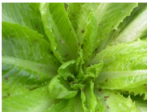
Imatge 4: Colònia de pugons en enciam

Durant el mes d'abril, les colònies de pugons (imatge 4) es consoliden i caldrà vigilar que no s'hi estableixin en aquells cultius que estiguin a punt de cabdellar.