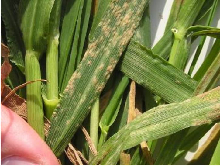
Blumeria graminis tritici/hordei Cendrosa del blat i de l'ordi