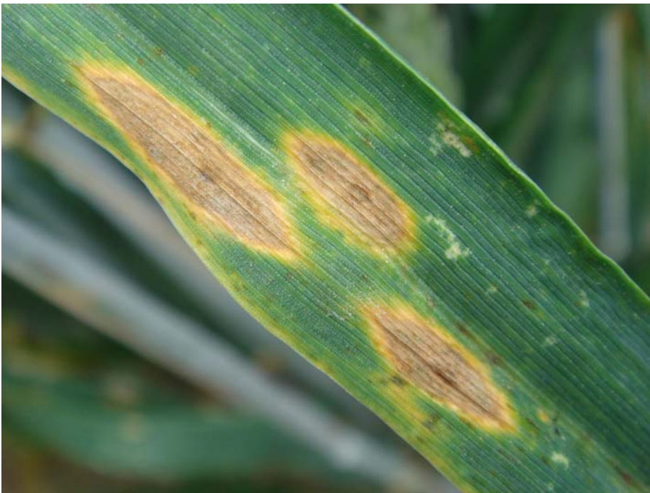
Drechslera tritici-repentis Helminthosporiosi del blat