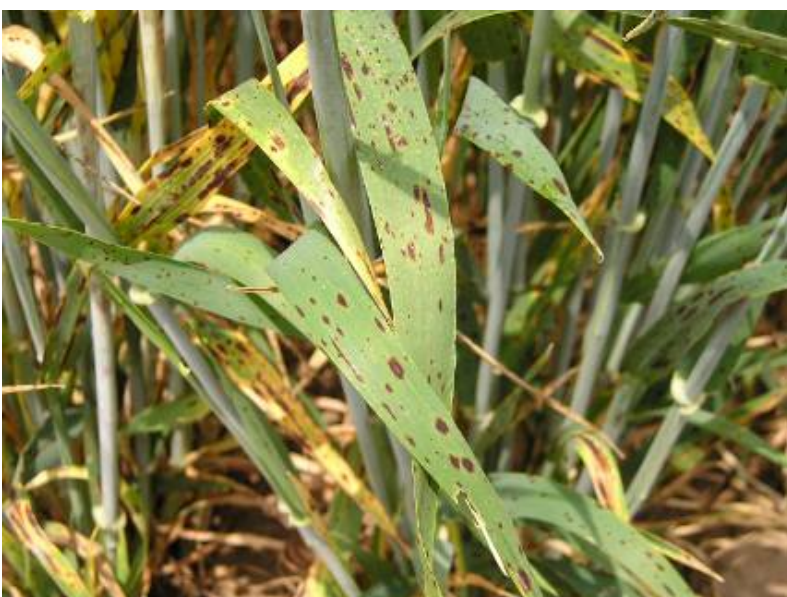
Drechslera teres , Bipolaris sorokiniana Helminthosporiosi de l'ordi