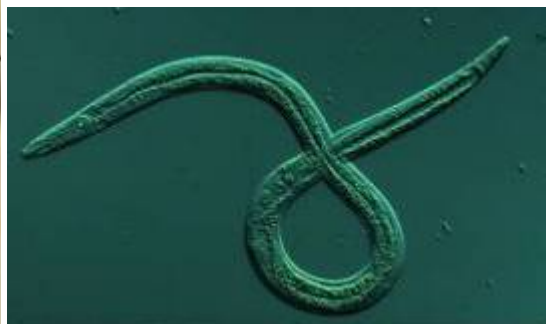
Bursaphelenchus xylophilus al microscopi

És un nematode que provoca la mort dels pins, i està associat amb diferents espècies de Monochamus (insectes coleòpters que actuen com a vectors del nematode). Les espècies més susceptibles són el pi pinastre o marítim ( P. Pinaster ), el pi roig ( P. Sylvestris ) i la pinassa ( P. nigra ).