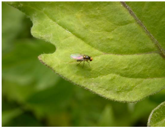
Imatge 1: Adult de Liriomyza trifolii

Insecte present en nombrosos cultius que afecta de manera important al tomàquet i la mongeta. Un dels seus trets característics és la taca groga que té al cap i la velocitat en que aixeca el vol. Aquesta plaga (imatge 1) ocasiona dos tipus de danys; picades alimentícies, que es manifesten en petits cercles blancs a sobre la fulla, i galeries formades per les larves, les quals generen gran quantitat de mines i poden arribar a reduir la capacitat fotosintètica de la fulla. Això afecta sobretot a les plantes més joves doncs es tradueixen en menors rendiments de la planta.