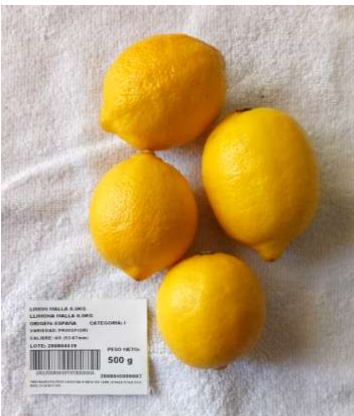
Llimones Primofiori