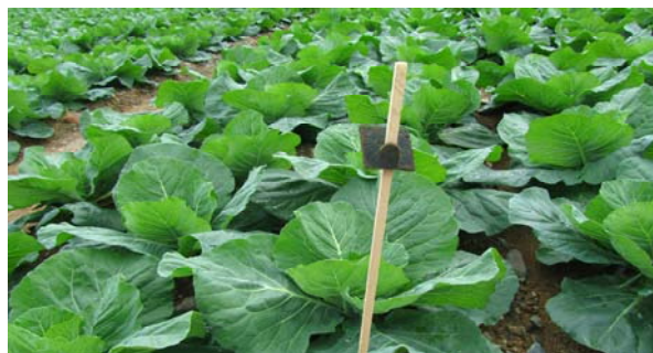
Figura 7. Confusió sexual contra Heliiothis armigera.