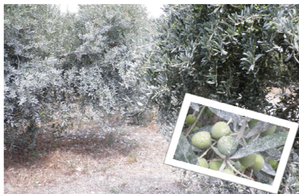
Figura 5. Finca tractada amb caolí