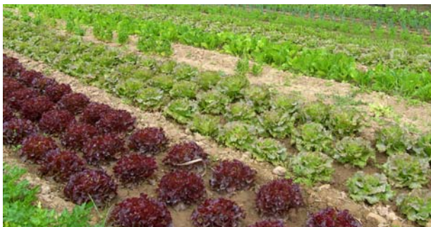
Figura 4. Finca d'horta ecològica.