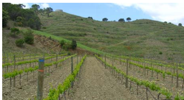
Figura 6. Finca de vinya ecològica