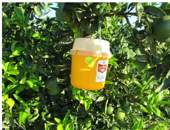
Figura 8. Trampes.