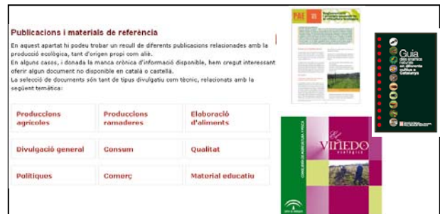
Figura 3. Publicacions sobre PAE al web del DAAM.