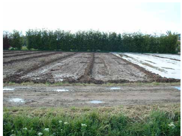
Foto 8: Camp d'assaig on s'ha realitzat una comparativa entre una biofumigació o una biosolarització (biofumigació + solarització).

Si bé l'objectiu principal de la biofumigació és el control de patògens del sòl, els efectes que indueix en el sòl i en la disponibilitat de nutrients pel cultiu posterior han de ser tinguts en compte per a un correcte pla de fertilització dels cultius. De totes maneres, resulta remarcable la importància d'establir programes de fertilització que considerin les característiques no només del biofumigant, sinó també del sòl on s'aplica.