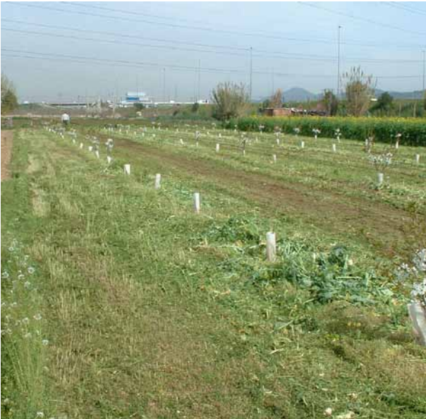
Foto 5: Trinxat de bràssiques en els carrers d'una plantació de fruiters.

paràmetres interessants a tenir en compte a l'hora d'escollir les varietats de bràssiques biofumigants.