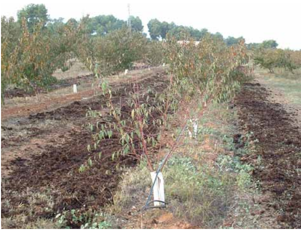
Foto 7: Aplicació de fems en biofumigació per solcs en fruiters.

S'ha comentat anteriorment que la no necessitat d'altres temperatures per a la seva aplicació permet de fer-ne ús en qualsevol època de l'any i en àrees de baixes temperatures. Tanmateix, si es preveuen temperatures del sòl massa baixes per a una correcta activitat dels microorganismes saprofítics (<15 °C), que es troben a la base de l'èxit de la biofumigació, pot convenir ajornar la seva aplicació a un altre període de l'any, en previsió d'una insuficient producció d'ITCs i d'una lenta degradació de la matèria orgànica.