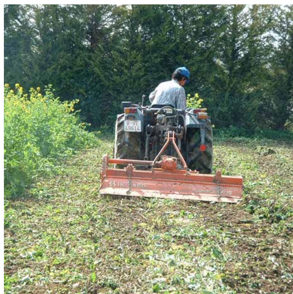
Foto 4: Trinxat i enterrament amb fresadora.

El moment del trinxat en la biofumigació amb bràssiques correspon al moment de la plena floració del cultiu (Sawar i Kierkegard, 1998), corresponent a la meitat del període de floració, moment en què el contingut de glucosinolats (precursors dels ITCs) en les plantes és màxim, sense que es presentin diferències significatives de contingut entre l'arrel i la part aèria. Un dels paràmetres més importants a l'hora d'escollir la varietat de bràssica a utilitzar és el temps que triga el cultiu en arribar a la floració, ja que necessitem adaptar-lo a la disponibilitat d'espai de la nostra alternativa de cultius, essent mínima (1 mes) en el cultiu de mostassa com a material biofumigant. Per altra banda, la quantitat d'ITCs produïts per planta és un altre dels