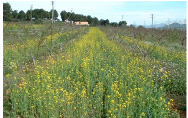
Foto 2: Cultiu de bràssiques en cultiu de fruiters.

Pel que fa a les matèries orgàniques útils per a la biofumigació del sòl, s'ha trobat que generalment qualsevol matèria orgànica pot actuar com a biofumigant. La seva eficàcia depèn principalment del tipus de matèria orgànica aportada, de la dosi i del mètode d'aplicació. En aquest sentit, hi ha tres grups principals de matèries orgàniques biofumigants: fems frescos, residus d'indústries agràries transformadores i cultius de bràssiques, que s'acaben incorporant al sòl al final del cultiu.