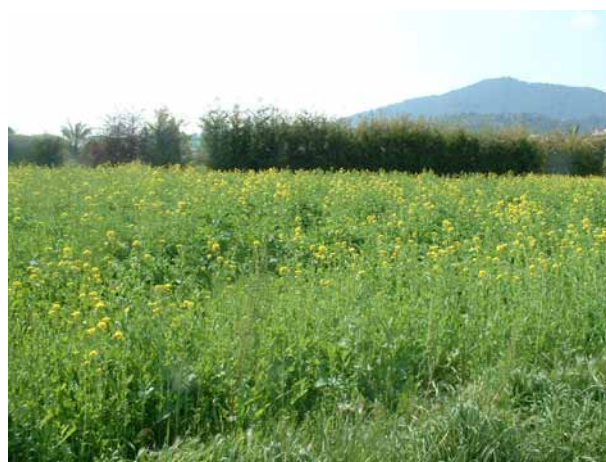
Foto 1: Cultiu de nap farratger per biofumigació.

Malauradament, la introducció dels adobs químics propicià l'oblit de la importància que té la fertilitat del sòl i la seva fertilització orgànica en l'autogestió de la sanitat dels agrosistemes. I així és com avui dia els patògens del sòl han esdevingut un dels problemes principals en la productivitat dels cultius, la qual cosa causa pèrdues milionàries any rere any, i obliga en agricultura convencional a l'aplicació de cada vegada més quantitat de desinfectants químics del sòl per poder-hi fer front. Un d'aquests desinfectants químics, el més conegut, és el bromur de metil (BM), prohibit des de l'any 2005. Les raons principals de la seva prohibició foren que entre el 50 i el 95% del BM aplicat a terra passava en forma d'emissions gasoses a l'estratosfera, on allibera àtoms de brom que reaccionen amb l'ozó i altres molècules estables que contenen clor, que dona lloc a una reacció en cadena que contribueix a la disminució de la capa d'ozó (Thomas 1997, en A. Bello et al. ). Gràcies a la prohibició d'ús d'aquest producte químic, la recerca d'alternatives per a la desinfecció dels sòls s'ha accelerat enormement.