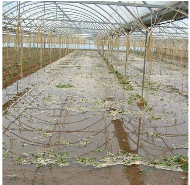
Foto 6: Segellat amb aigua dins hivernacle.

Una de les claus del segellat del sòl, que repercuteix directament i fortament sobre l'efectivitat de la biofumigació, és que es faci immediatament després de l'enterrament de la matèria orgànica, siguin bràssiques, fens o altres residus. En cas contrari, l'inici de la descomposició de la matèria orgànica per via aeròbica (amb oxigen) faria perdre part de les propietats biofumigants del material. Aquesta etapa del procés biofumigant dura dues setmanes, encara que es pot considerar necessari d'allargar-la uns dies si la pressió de patògens en el sòl és molt alta, o si la temperatura del sòl és massa baixa i ralenteix la degradació de la matèria orgànica.