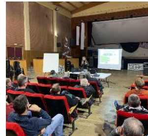
Foto 1.-Jornada Castellidans

Aquest 2019 en les activitats promogudes pel PATT, jornades, seminaris i visites tècniques organitzades per l'Oficina del Regant-EA de Tàrrrega han comptat amb 1.109 persones . Cal destacar la presència en les principals fires com Sant Josep o Sant Miquel, o en la transferència adaptada a les diferents comunitats de regants, entre d'altres.