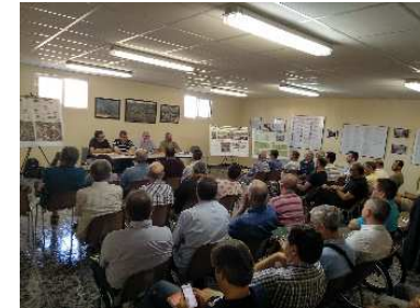
Foto 2.- Visita Riu Net

En formació han passat 244 alumnes en els diferents cursos i altra formació promoguda des de l'OdR. Com sempre cal destacar el curs de reg a distància que ha arribat a la 32 ena edició. Aquestes últimes edicions s'ha promogut una activitat pràctica en formació de reg a les Escoles Agràries de Tàrrrega i Manresa.