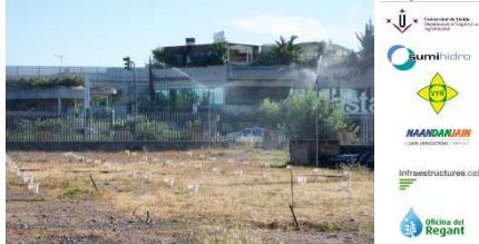
Foto 4.- Assaig aspersió a l'ETSEA

L'objectiu de l'assaig durant el 2019 va ser avaluar si es podia aconseguir una uniformitat adequada en reg per aspersió amb cobertura total en un únic marc d'aspersió: 18 x 18 i dos tipus de pressió: a 2 atm i a 3 atm. Les empreses van aportar 6 tipus d'aspersors, 3 per cada tipus de pressió. Es van realitzar 13 proves per comparar l'objectiu.. Aquest és continuació de les proves del 2017.