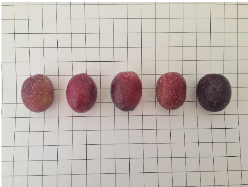
Fruit de la varietat 'Arbocet'