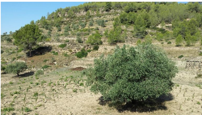
Olivera de la varietat 'Arbocet'