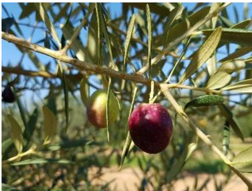
Detall de l'oliva 'Arbocet'