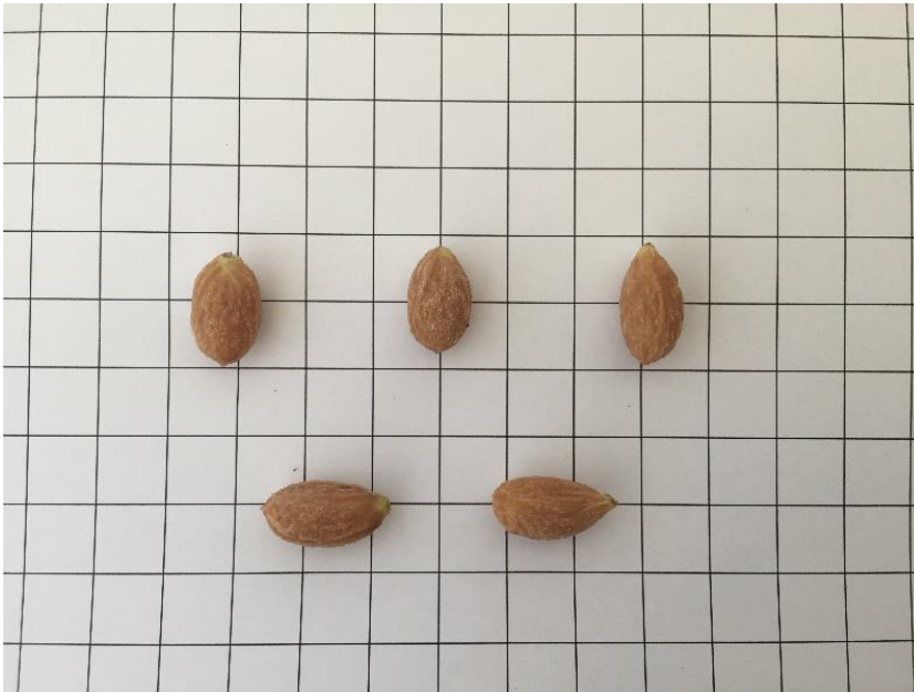
Detall de l'endocarpí d'Arbocet'