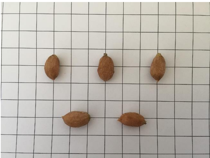
Detall de l'endocarpi de la varietat 'Llei valero'