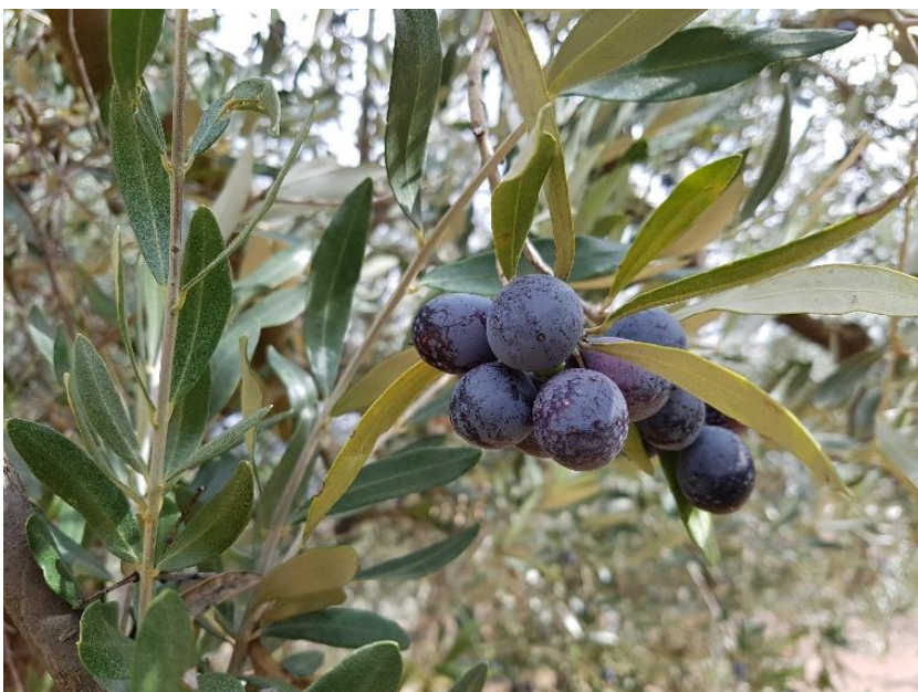
Detall del fruit de la varietat 'Llei valero'