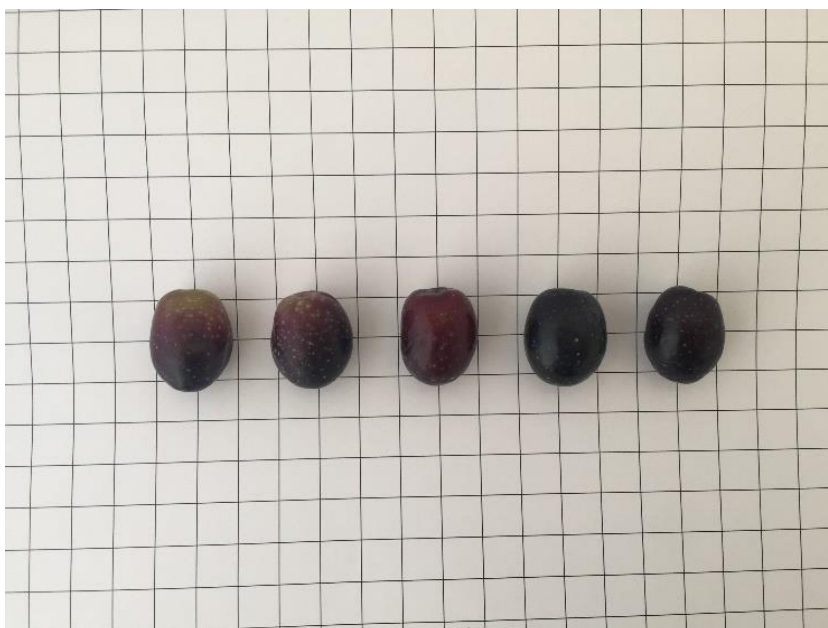
Detall del fruit de la varietat 'Llei valero'