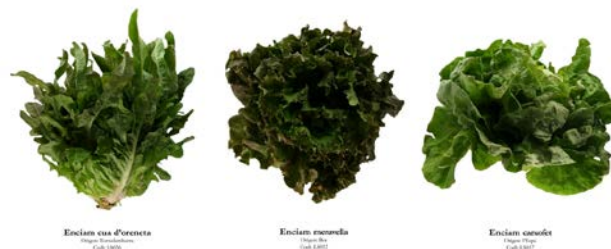
Figura 1. Imatges de diferents varietats tradicionals catalanes d'enciam. D'esquerra a dreta: Cua d'oreneta, Meravella i Carxofet.