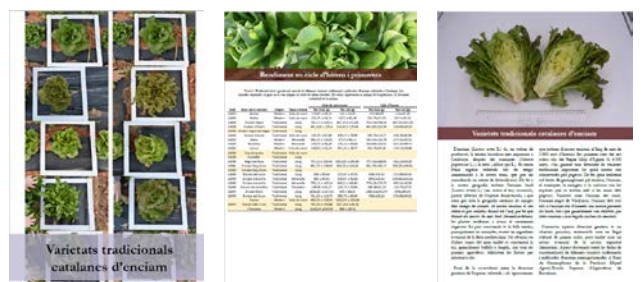
Figura 4. Imatges de l'informe de preconització amb les dades de caracterització publicat a la pàgina web de la Fundació Miquel Agustí.