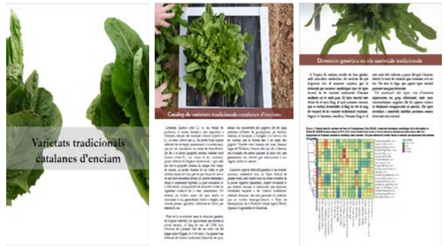
Figura 3. Imatges del catàleg de varietats tradicionals d'enciam elaborat en el marc del projecte.