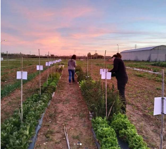
Figura 6. Imatges de dels de les jornades de camp organitzades en els diferents cultius experimentals d'enciam.