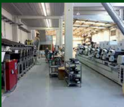
Instal·lacions de l'empresa Etiquer.

Etiquer pot treballar amb l'etiquetatge de múltiples productes: oli, vi, productes fitosanitaris, etc., amb una àmplia oferta de varietats i models (relleus, estampats, coures...) que la converteixen en una empresa referent dins del sector.