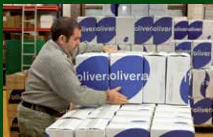
Celler de l'Olivera.

Pel que fa a l'activitat productiva, l'entitat treballa respectant els cicles de la natura i aplicant els criteris de l'agricultura ecològica. Es manté el treball manual sobre la vinya i les oliveres, s'etiqueten i es numeren a mà una a una les ampolles de vi i d'oli; fet que permet integrar les persones amb dificultats al treball de la cooperativa.