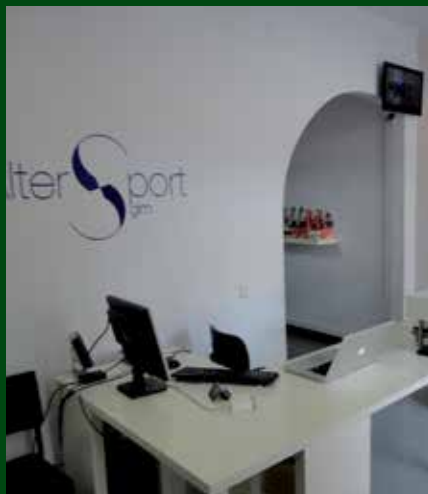
Instal·lacions Alter Sport. Autor: Associació pel Desenvolupament Rural de la Catalunya Central

L'equip d'Alter Sport treballa per esdevenir un referent en l'aplicació de les noves tecnologies en tots els vessants de l'esport, i també en la promoció de les activitats esportives entre la població. Posa èmfasi tant en l'àmbit local, en relació amb els serveis esportius, com en el nacional i, fins i tot, internacional pel que fa a les noves tecnologies.