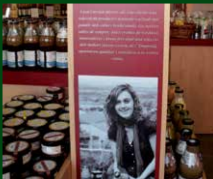
Presentació de la nova gamma de productes de Casa Carriot a una agrobotiga. Autor: Productes Alimentaris Macau

L'empresa també col·labora amb els col·lectius de cuina local, com La cuina de l'empordanet i La cuina del vent. Pel que fa a la gamma de brous i fumets, s'ha establert un acord de col·laboració amb Els pescadors de Roses, i així s'elaboren els plats amb peix proporcionat directament per aquesta entitat associativa.