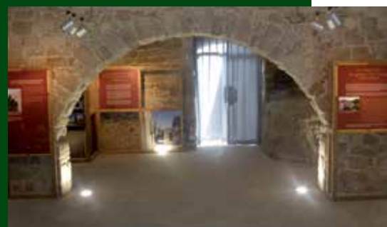
Sala principal del Castell de Castellar.