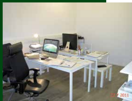
Interior de Web 3.0 TV. Autor: Associació per la Gestió del Programa Leader Ripollès Ges Bisaura