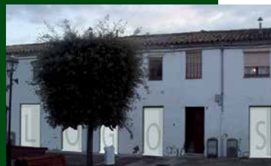
Façana entrada Logos Berguedà. Autor: Logos Berguedà