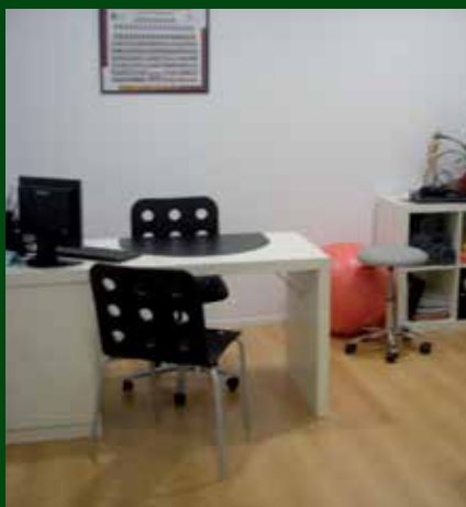
Sala de treball del Centre Fisiològics Agramunt.

La filosofia de Fisiològics Agramunt es basa en una atenció personalitzada i individualitzada que valora les necessitats del pacient en cada moment i posa a disposició seva tots els mitjans humans i tècnics disponibles per a la seva recuperació.