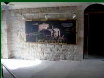
Entrada principal Castell de Castellar.

Aquesta iniciativa busca preservar un dels elements patrimonials més característics del territori i convertir-lo en un actiu turístic que complementi l'oferta de la comarca, a més de sensibilitzar la població sobre la importància dels recursos de què disposa.