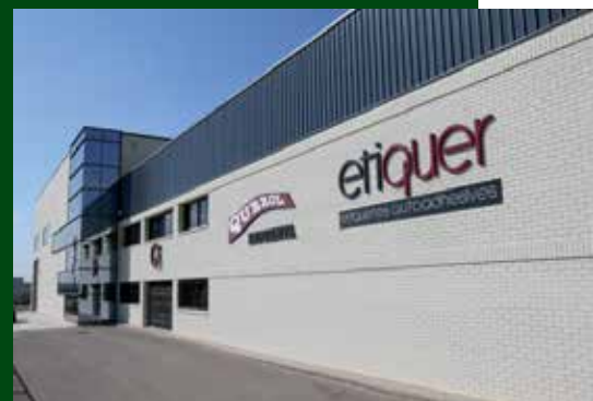
Instal·lacions de l'empresa Etiquer. Autor: ETIQUER SL.