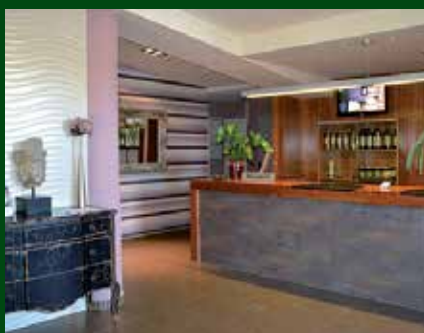
Recepció de l'Hotel Vilar Riu de Baix.

Cal subratllar que l'hotel té un contracte de cessió d'una part de la finca amb l'entitat Grup de Natura Freixe, membre de la Xarxa de Custòdia del Territori. Aquest acord s'emmarca dins el projecte Programa triennal de custòdia a la Reserva Natural de Sebes i meandre de Flix, que pretén que aquesta finca sigui una experiència pilot de custòdia on s'elaborin estudis específics de millora i expansió de l'hàbitat del bosc de ribera, millora paisatgística de l'entorn i eliminació i/o control d'espècies exòtiques, entre d'altres.