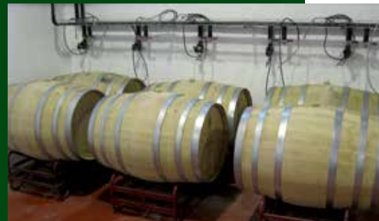
Zona de microvinificació i experimentació. Autor: Consorci de Desenvolupament Alt Camp, Conca de Barberà i Anoia