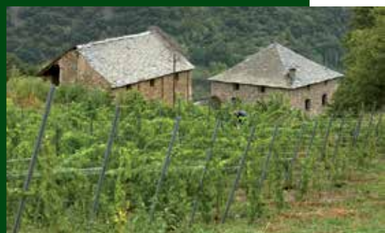
La borda i vinyes de Celler Batlliu de Sort.