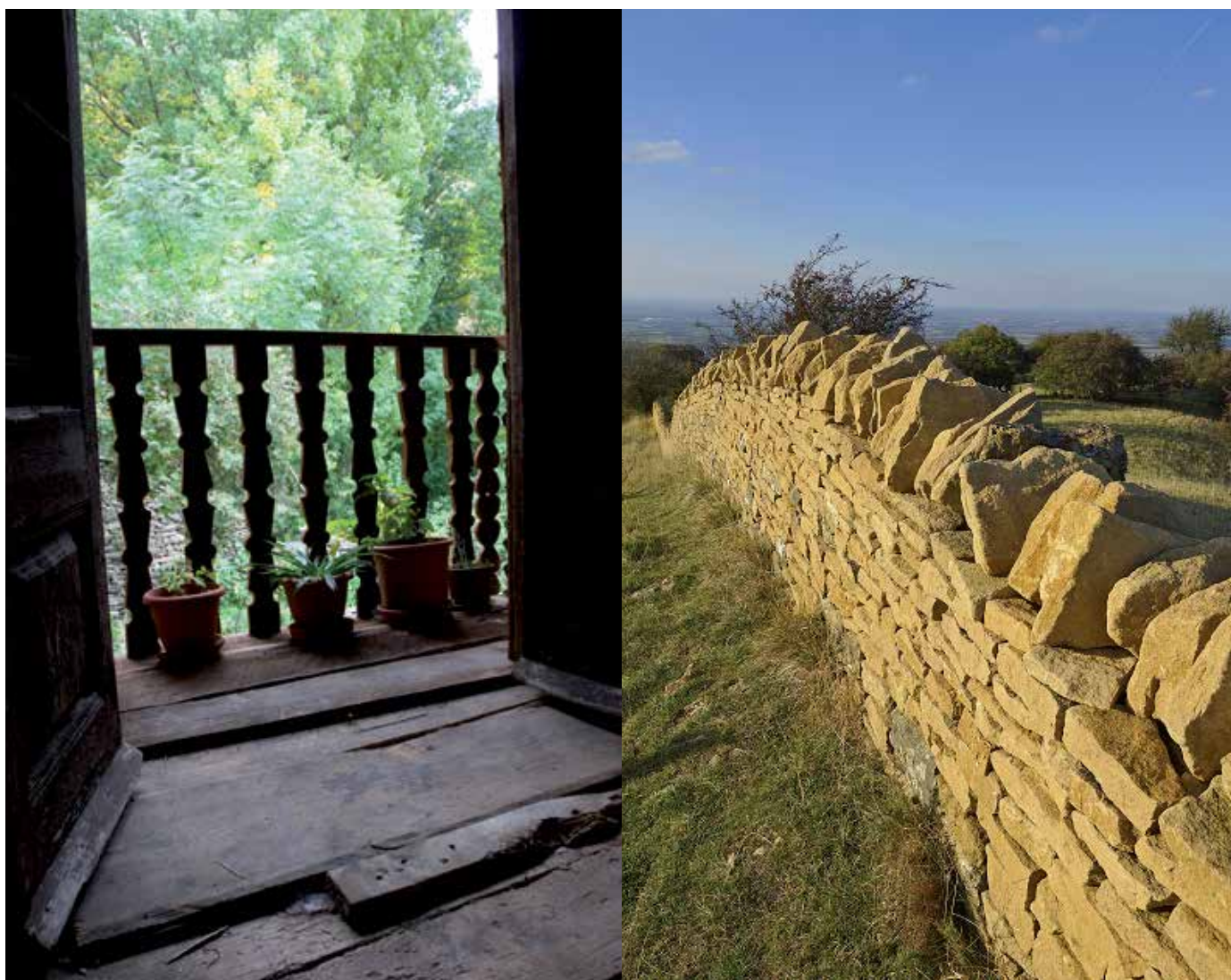
Foto 1 i 2. Una manera de treballar i entendre el desenvolupament rural que passa de "compartir informació" a "actuar en comú" i "d'aprendre junts" a "fer junts".