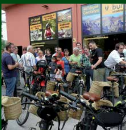
Inauguració de les instal·lacions de Socarrel a la Seu d'Urgell.

Amb la Burricleta, es vol consolidar un model d'ecoturisme de qualitat, reforçar els valors de la sostenibilitat, la preservació i l'apreciació del medi natural i cultural de la zona, i també dinamitzar les poblacions locals a través de l'impuls de sinergies comunes.