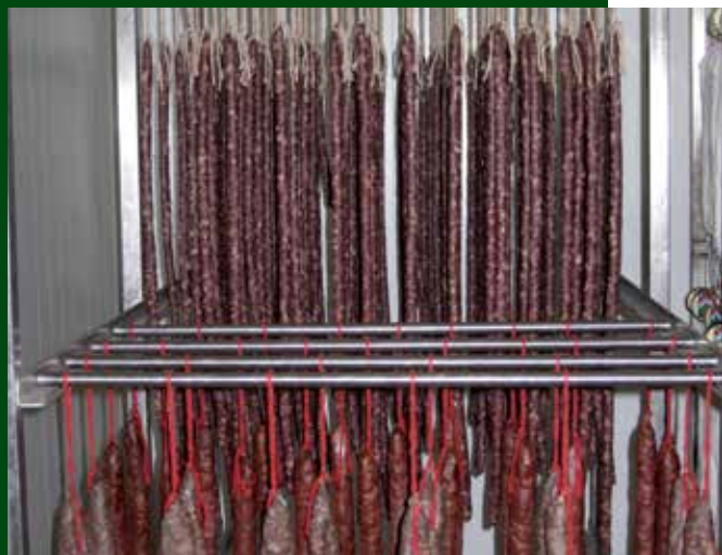
Procés d'assecat d'embotits.

Amb aquest projecte, s'impulsa la producció i comercialització dels productes del territori, a més de reforçar el teixit econòmic de la comarca.