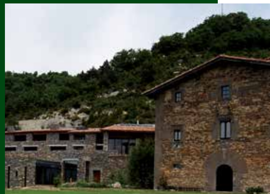
Vista panoràmica de les instal·lacions i equipaments de l'aparthotel l'Avenc de Tavertet.