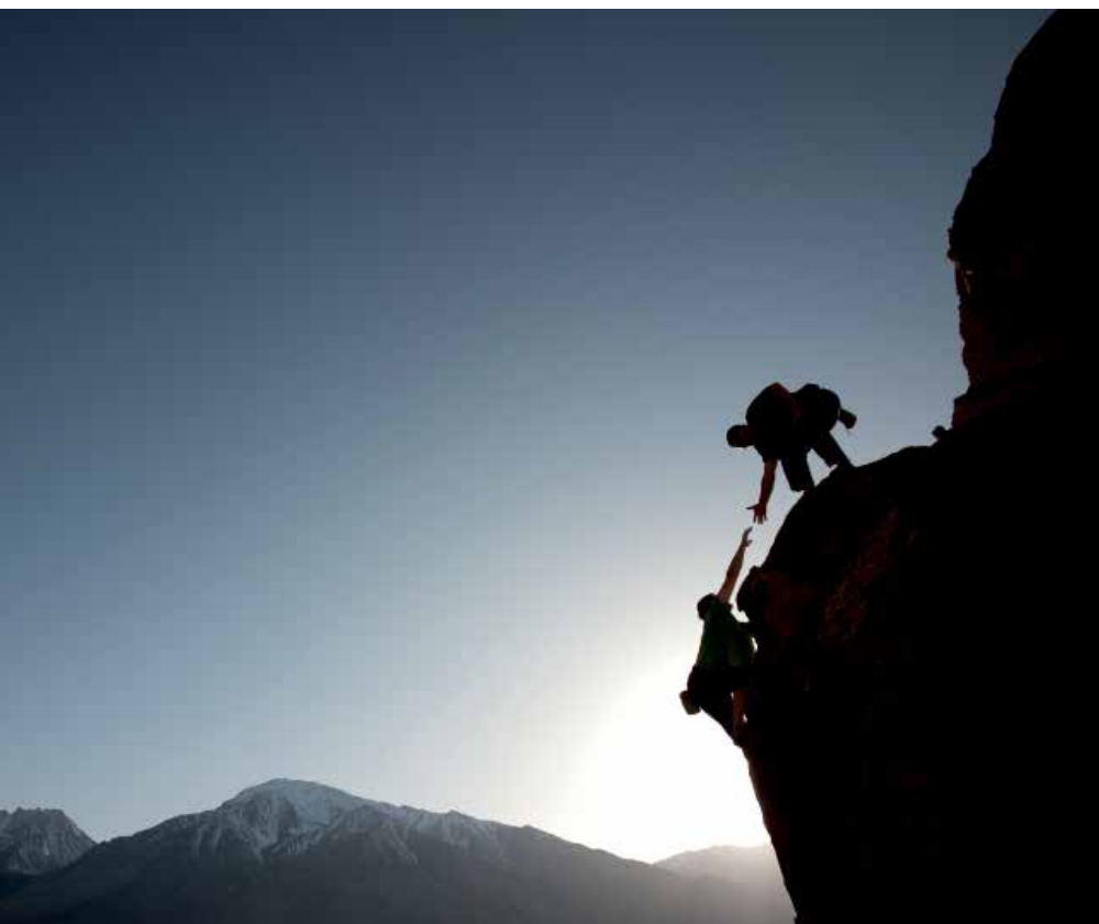
Foto 2. Leader contribueix a la governança del territori.

A través d'aquesta mesura, els ajuts Leader han permès a les entitats locals consolidar diferents projectes d'embelliment de nuclis antics i de recuperació de l'arquitectura tradicional, i establir sinergies amb activitats de promoció i difusió del patrimoni rural català.