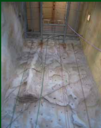
Instal·lacions Drac Actiu. Autor: Consorci de Desenvolupament Alt Camp, Conca de Barberà i Anoia

Amb la construcció del rocòdrom i la millora de les instal·lacions, Drac Actiu amplia l'oferta de serveis i activitats. Això permet la pràctica de l'escalada a tots els nivells i durant tot l'any.