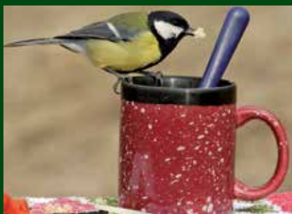
Mallarenga carbonera. Jardí dels Ocells a Montsonís. Autor: Jordi Bas

L'objectiu general del projecte és crear noves vies de dinamització de l'activitat empresarial turística a partir d'elements nous i atractius, al voltant de les rutes de natura i ornitologia, com a noves oportunitats de negoci a través d'accions que promoguin la sostenibilitat i l'equilibri econòmic a la zona.