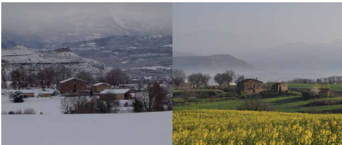
Foto 1 i 2. Leader aposta per la transparència i l'ètica empresarial. Autor: Consorci per al Desenvolupament de la Catalunya Central