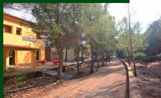
Entorn de l'antiga estació de Benifallet.