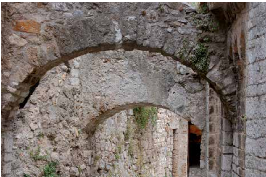
Foto 3. Leader aposta per fer xarxa i actuar en comú.