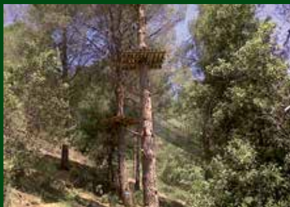
Vista de les instal·lacions del parc.

oCircuit de ponts tirolesos: per a intrèpids sense por a les alçades i amants de la velocitat aèria. Circuit format per 5 ponts tirolesos d'entre 90 i 130 metres de llargada.