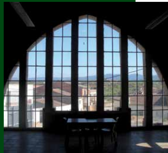
Vista interior de la vidriera de la façana principal de l'edifici de la Cooperativa. Autor: Cooperativa de l'Albi