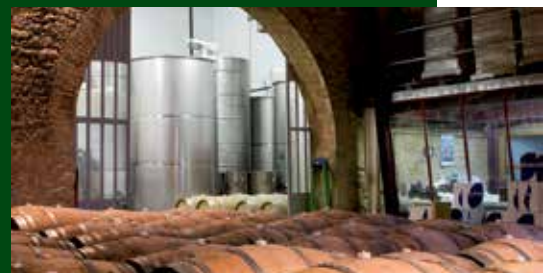
Celler de l'Olivera. Autor: L'Olivera