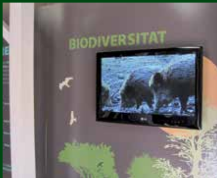
Interior del Centre de Desenvolupament Forestal. Autor: Associació per la Gestió del Programa Leader Ripollès Ges Bisaura