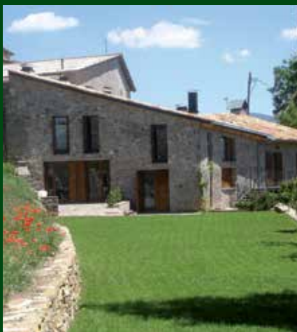
Façana i jardí de Casa l'Hereu. Autora: Lídia Caselles

Cal subratllar que la impulsora del projecte és una jove que es vol establir a la zona, fet que dóna un valor afegit a la iniciativa i pot servir de referència a altres persones que vegin el fet d'establir-se en un entorn rural com una possibilitat.