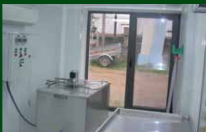
Obrador de la formatgeria Valette.

Un altre valor afegit del projecte ha estat la implantació de la Responsabilitat Social Empresarial en la gestió de l'activitat.