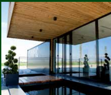
Edifici principal de l'empresa Maskopic. Autor: Maskopic

L'objectiu general del projecte és dinamitzar econòmicament tant l'empresa com tot el seu entorn. En aquest sentit, la seva estratègia de màrqueting preveu donar protagonisme i visibilitat als seus proveïdors davant dels seus clients. Seguint aquesta línia, i amb l'objectiu que els clients coneguin l'origen dels animals i dels productes que adquireixen, Maskopic organitza visites guiades a les empreses proveïdores.