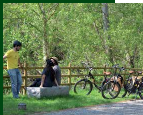
Sortida amb burricleta al Baridà.