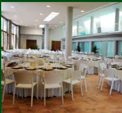
Sala de banquets i celebracions de l'Avenc de Tavertet.

Així doncs, amb l'ampliació i inversió que suposa aquest projecte, l'empresa podrà desestacionalitzar les reserves pel fet de tenir zones cobertes i climatitzades, tant perquè es podrà fer servir tot l'any com perquè permetrà treballar amb empreses, escoles i col·lectius entre setmana a més de comptar amb el turisme familiar els caps de setmana.