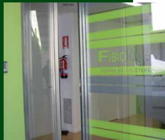
Entrada Centre Fisiològics Agramunt.