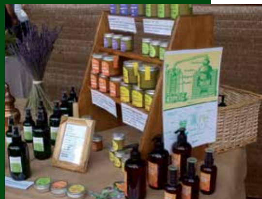
Gamma de productes de cosmètica natural de Carícies d'Oli. Autor: Carícies d'oli

El projecte empresarial inclou la creació d'una botiga en línia que pretén ser un punt clau en la difusió i comercialització dels productes de Carícies d'Oli.