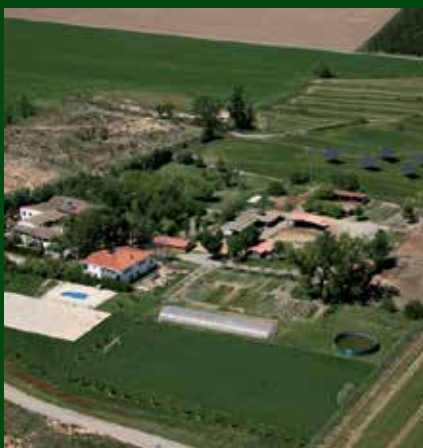
Vista general de la granja escola.

La fundació també treballa en la recerca de la col·laboració econòmica entre institucions, empreses i particulars per becar part del cost de les teràpies als usuaris que més ho necessiten.