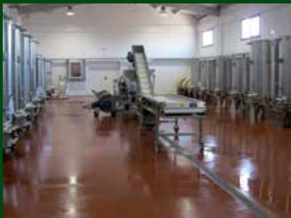
Instal·lacions del viver de celleristes.

L'entitat vol impulsar la creació de noves empreses del sector vinícola que tanquin el cercle productiu i aportin valor afegit al territori. Des de la seva posada en funcionament, dos emprenedores que van iniciar el seu projecte gràcies al viver han creat celler propi, amb la qual cosa han contribuït a augmentar l'activitat econòmica del territori.