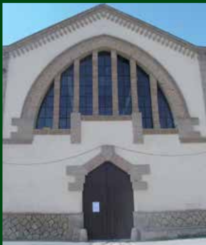
Façana principal de l'edifici de la Cooperativa de L'Albi. Autor: Cooperativa de l'Albi

En aquesta inversió, la cooperativa implementa millores en la línia d'envasatge i taponament i en el procés d'emmagatzematge i etiquetatge de l'oli. Alhora, inverteix en una caldera de biomassa per aprofitar el pinyol d'oliva residual que genera l'activitat. Amb totes aquestes millores, Agrícola de l'Albi treballa per esdevenir una empresa més sostenible i per garantir els paràmetres físics i químics i les característiques organolèptiques del seu producte per fer que el seu oli sigui de millor qualitat.