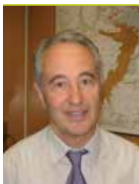
Jordi Sala Casarramona Director General de Desenvolupament Rural

La importància del medi rural en el conjunt del territori de Catalunya es fa palesa amb poques dades: representa més de tres quartes parts de la superfície de Catalunya, i, en canvi, hi viu poc més del 10% de la població catalana. A banda, aquestes zones preserven els recursos naturals, mantenen la diversitat de paisatges, donen resposta als consumidors en matèria de seguretat i qualitat alimentària, són generadores d'activitat econòmica, etc. En definitiva, cal subratllar la importància que té el món rural i els ciutadans que hi habiten en la generació d'externalitats positives per a tota la societat.