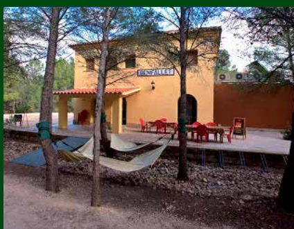
Façana de l'edifici principal de l'antiga estació de Benifallet. Autor: Vicent Ibàñez Martí

També s'ha habilitat un terreny d'acampada perquè els visitants que ho desitgin puguin passar una nit diferent. El projecte és punter en la transformació de l'entorn natural i la recuperació del patrimoni en l'enclavament de la via verda de la Val de Zafán.