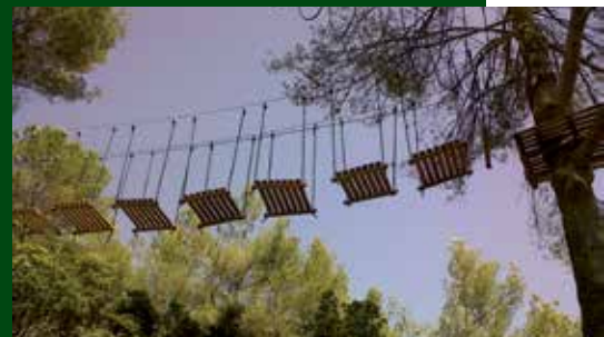
Vista de les instal·lacions del parc.