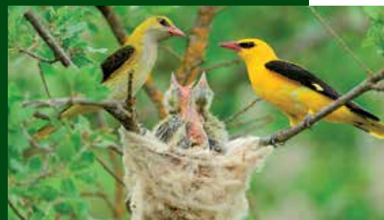
Oriols a Montsonís.