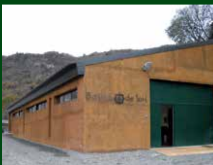
Equip del Celler Batlliu de Sort. Autor: Celler Batlliu de Sort

En l'actualitat, el canvi climàtic fa que cada vegada s'intenti plantar vinya en cotes més altes. Mentre la temperatura puja una mitjana d'1,2°C a les zones vinícoles tradicionals, Itàlia planta vinyes als Alps i Alemanya comença a ser una referència. Àustria ja fa temps que cultiva vins de qualitat, i fins i tot al sud d'Anglaterra s'estan construint nous cellers. Aquest fet dóna una major rellevància al projecte Celler Batlliu, ja que és una proposta que està donant bons resultats i, per tant, pot obrir una nova possibilitat de desenvolupament a tot el territori pirinenc.