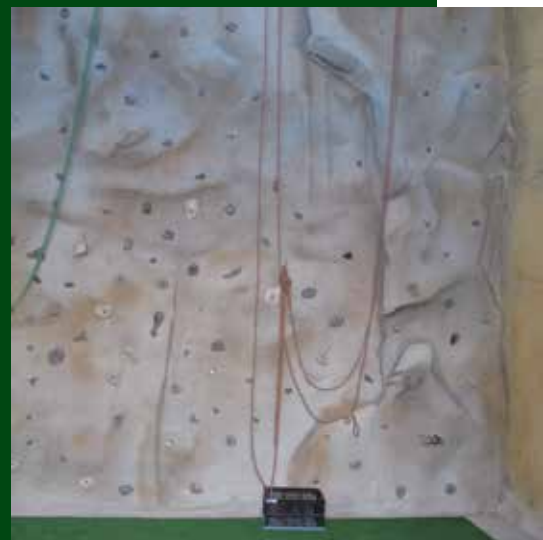
Instal·lacions Drac Actiu. Autor: Consorci de Desenvolupament Alt Camp, Conca de Barberà i Anoia