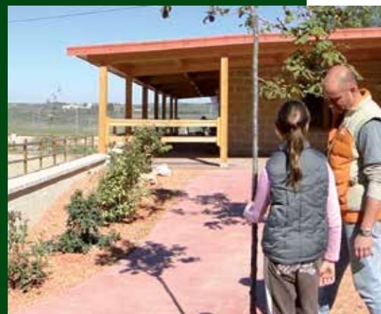
Instal·lacions de la granja escola.