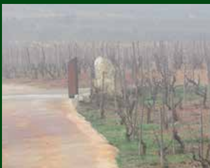
Entrada a la finca de Vinyes Domènech.

La finca de Vinyes Domènech, situada a Capçanes, pertany a la DO Montsant des de l'any 2004 i compta amb ceps d'una edat compresa entre els 12 i els 70 anys. Les varietats amb què treballa el celler són: Garnatxa vella de 70 anys, Merlot, Cabernet Sauvignon i Syrah.