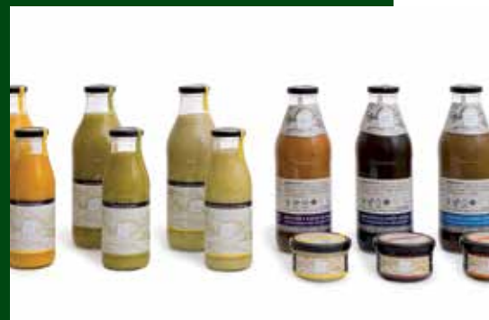
Gamma de productes Casa Carriot: cremes, salses i brous. Autor: Productes Alimentaris Macau