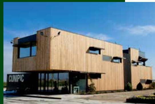
Edifici principal de l'empresa Maskopic. Autor: Maskopic