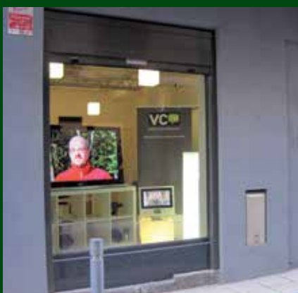
Interior de Web 3.0 TV.

Valldecamprodon.tv és més que una televisió local i convencional; gràcies a Internet, tota la informació de la vall de Camprodon és a l'abast de tothom en tot moment, fet que l'ha convertida en el canal de comunicació entre els habitants de la vall de Camprodon.