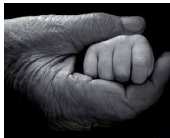
Foto 5. Leader vetlla per un desenvolupament sostenible que no comprometi a les noves generacions.

Durant aquest temps, s'han certificat unes 200 empreses rurals que apliquen la RSE, i la metodologia i la xarxa de professionals s'han incorporat, ara sí definitivament, a la metodologia Leader de Catalunya.