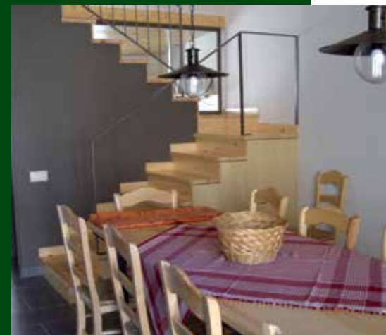
Interior de Casa l'Hereu. Autor: Consorci Centre de Desenvolupament Rural Pallars - Ribagorça