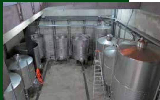
Instal·lacions Vinyes Domènech.