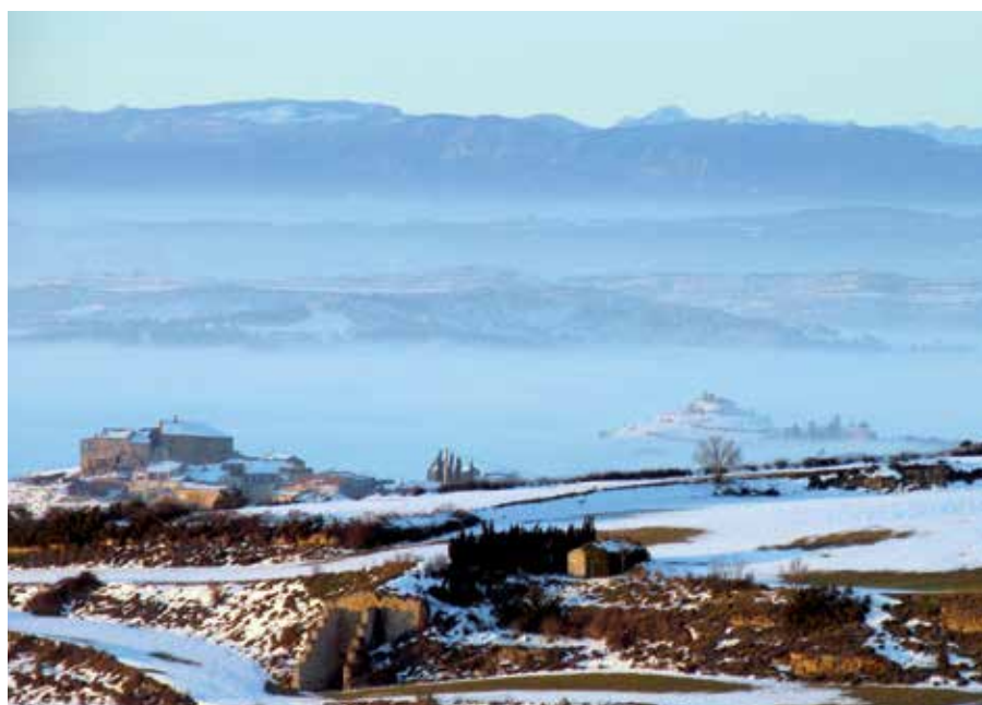
Foto 3. Impulsem iniciatives conjuntes tenint en compte la idiosincràsia de cada territori. Autor: Consorci per al Desenvolupament de la Catalunya Central

Una manera de treballar i entendre el desenvolupament rural que passa de "compartir informació" a "actuar en comú" i "d'aprendre junts" a "fer junts"