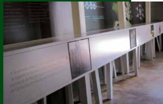
Interior del Centre de Desenvolupament Forestal. Autor: Associació per la Gestió del Programa Leader Ripollès Ges Bisaura