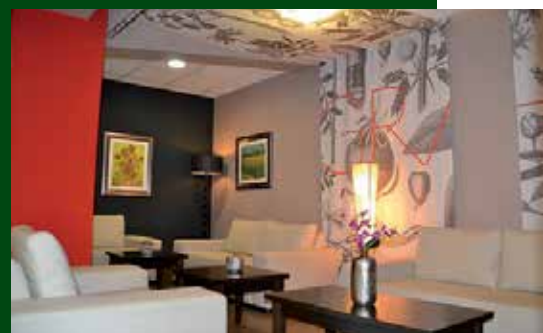
Sala Polivalent de l'Hotel Vilar Riu de Baix.