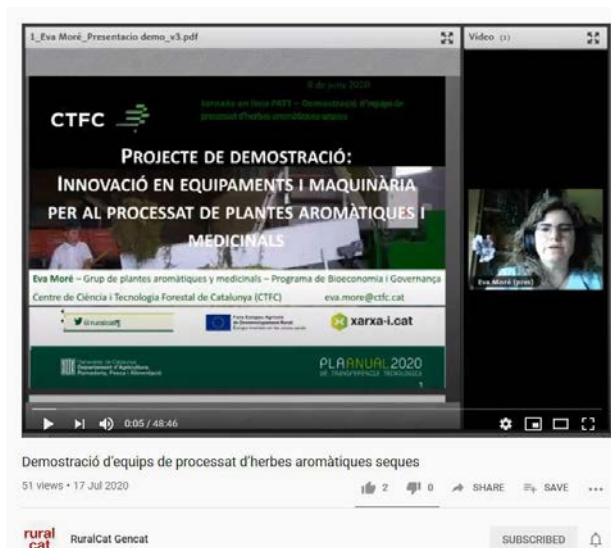
Imatge 3. Presentació de la base de dades en una de les jornades de demostració en línia.

Pressupost total del projecte: 29.619,20 € Contribució de la UE al pressupost: 12.736,26 €