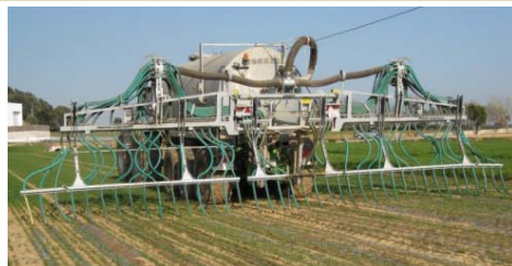
Aplicació amb mànegues