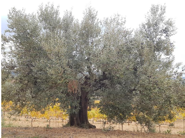
Olivera de la varietat 'Corberana'