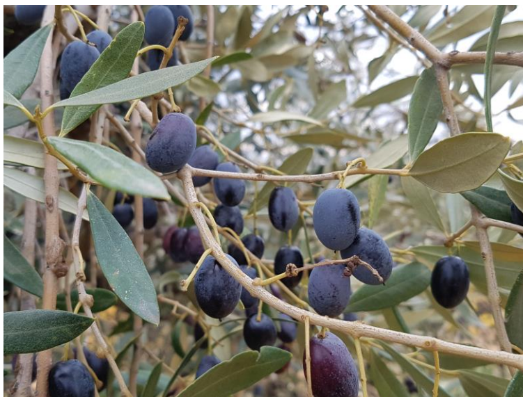
Fruit de la varietat 'Corberana'