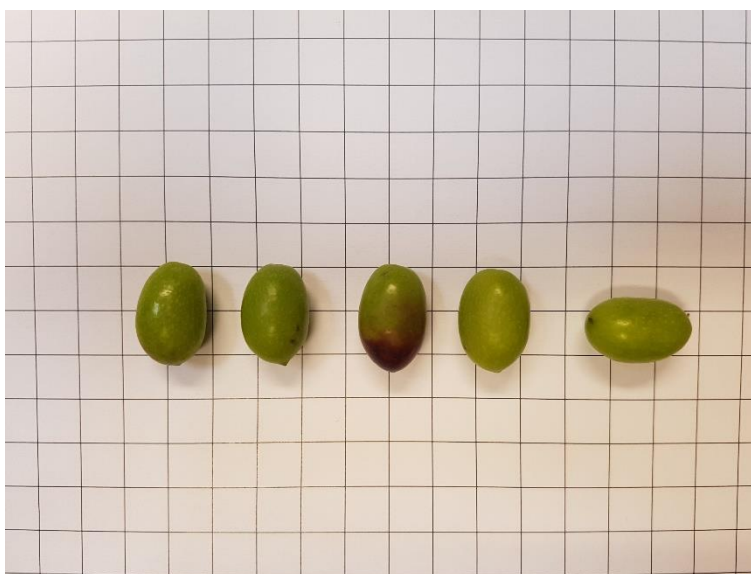
Detall de l'oliva 'Corberana'