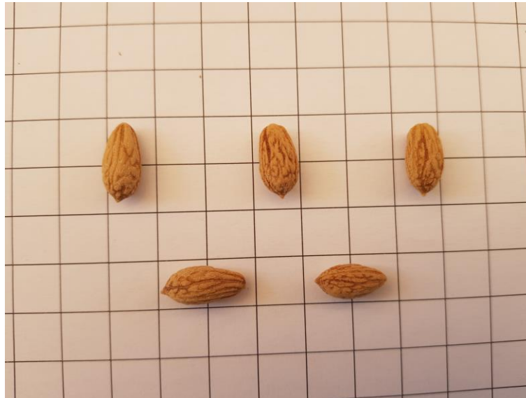
Detall de l'endocarp de 'Corberana'