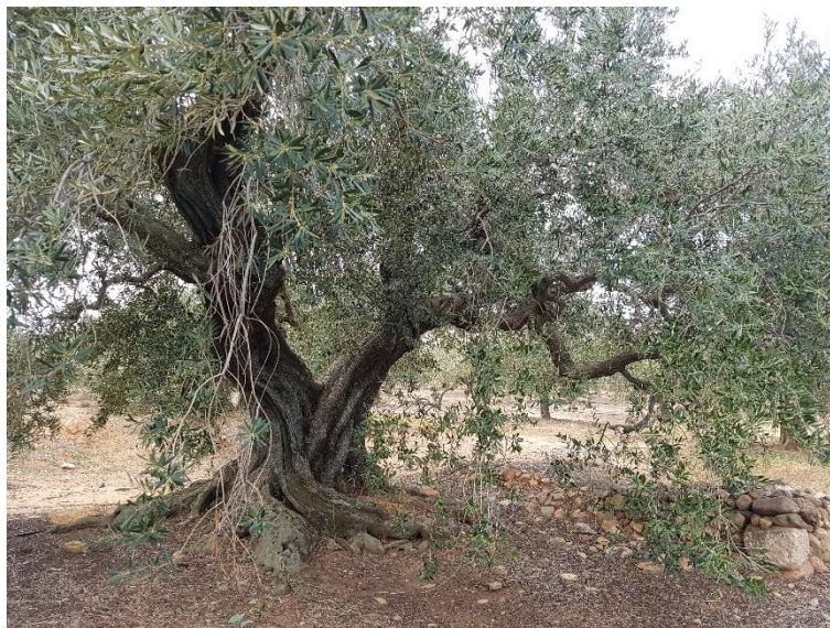
Olivera de la varietat 'Llei del bessó'