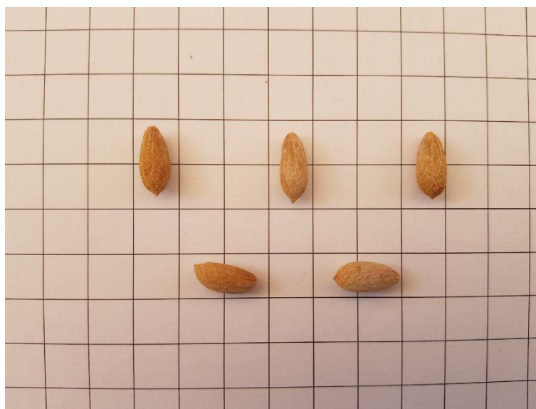
Detall de l'endocarpi de 'Llei del bessó'