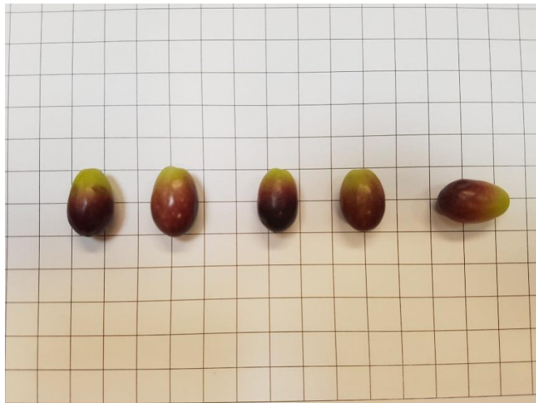
Detall de l'oliva 'Llei del bessó'