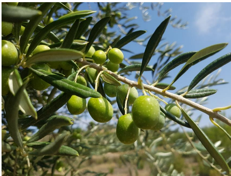
Fruit de la varietat 'Mançanenca de Batea'