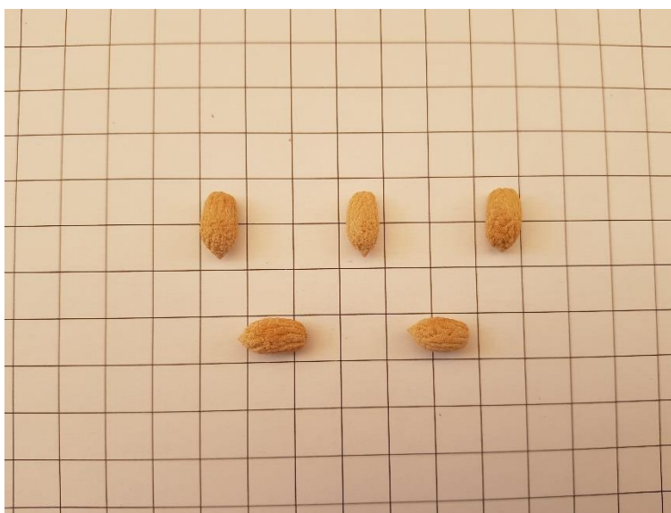
Detall de l'endocarpi de 'Mançanenca de Batea'