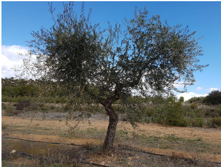
Olivera de la varietat 'Mançanenca de Batea'