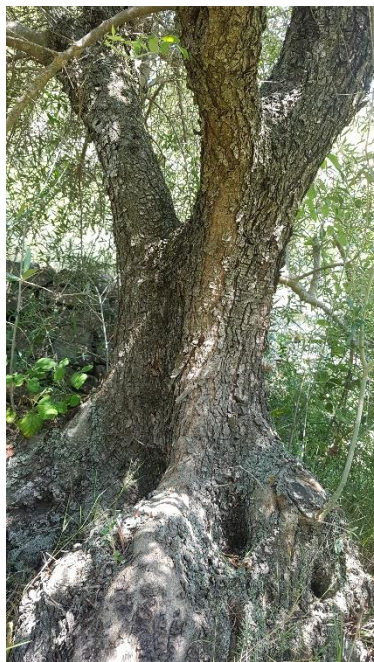
Olivera de la varietat 'Manubenca'