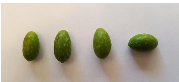
Detall de l'oliva 'Manubenca'