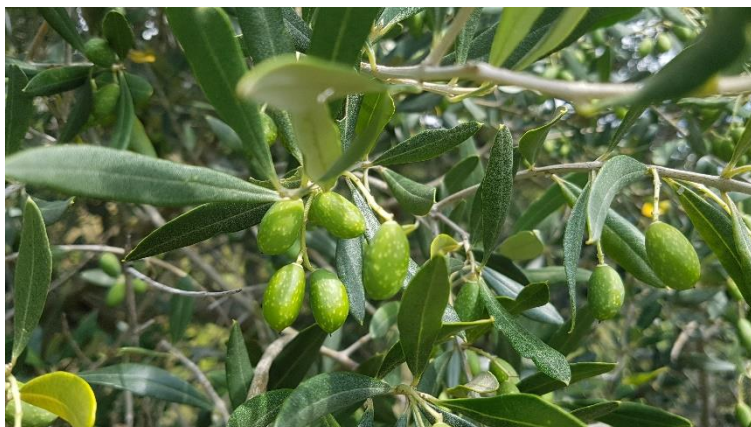
Fruit de la varietat 'Manubenca'