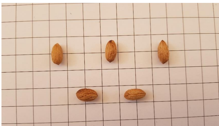
Detall de l'endocarpi de 'Manubenca'