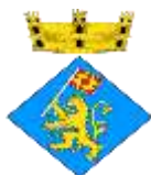
Ajuntament de Ventalló