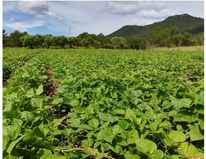
Foto 1. Camp de mongetes a Castellfollit del Boix.

4.2. Contacte amb els agents del sector de les zones identificades.