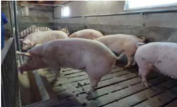
Foto 1. Exemple de corral de mares on es duria a terme l'activitat.