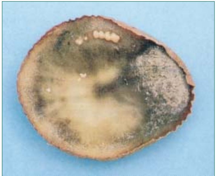
Foto 4. Aspecte que pot presentar un tubercle contaminat per podridura bruna alguns dies després de ser trossejat.

Si trobeu símptomes sospitosos, aviseu urgentment al Servei de Sanitat Vegetal del DARP.